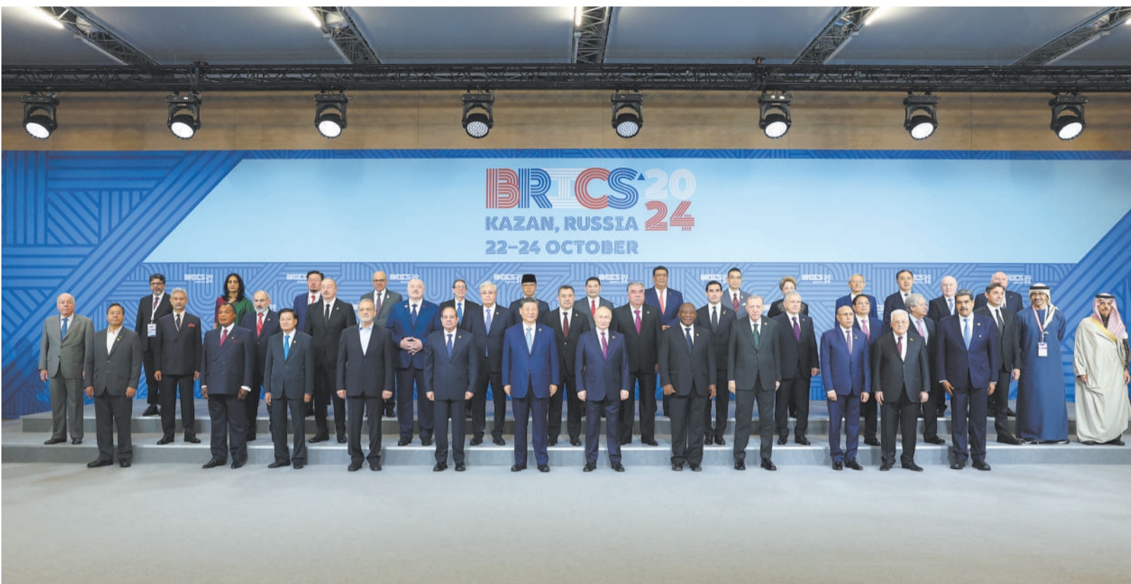
当地时间10月24日上午，国家主席习近平在喀山会展中心出席“金砖+”领导人对话会并发表题为《汇聚“全球南方”磅礴力量 共同推动构建人类命运共同体》的重要讲话。这是出席对话会的金砖国家及嘉宾国领导人或代表、国际组织负责人集体合影。