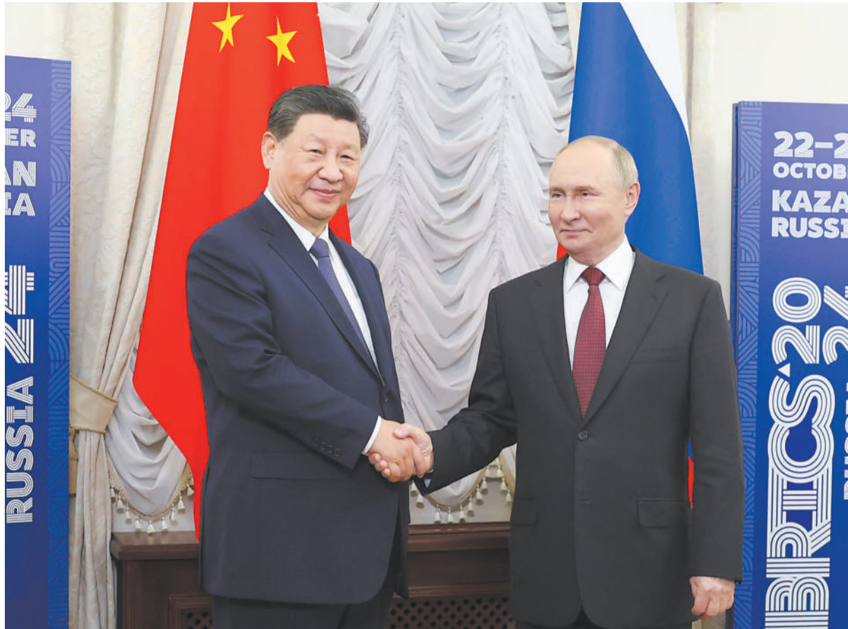
当地时间十月二十二日下午，国家主席习近平在喀山克里姆林宫同俄罗斯总统普京举行会晤。 新华社记者 丁海涛摄

新华社俄罗斯喀山10月22日电（记者郝薇薇 黄河）当地时间10月22日下午，国家主席习近平在喀山克里姆林宫同俄罗斯总统普京举行会晤。 习近平指出，今年是中俄建交75周年。75年来，中俄关系风雨兼程，探索出“不结盟、不对抗、不针对第三方”的相邻大国正确相处之道。双方秉持永久睦邻友好、全面战略协作、互利合作共赢精神，不断深化和拓展全面战略协作和各领域务实合作，为推动两国发展振兴和现代化注入强劲动力，为增进中俄人民福祉、维护国际公平正义作出重要贡献。当前，世界正处于百年未有之大变局，国际形势变幻莫测，但中俄世代友好的深厚情谊不会变，济世为民的大国担当不会变。尽管面临复杂严峻的外部形势，两国贸易等各领域合作积极推进，大型合作项目稳定运营。双方要继续推动共建“一带一路”倡议和欧亚经济联盟深入对接，为促进各自经济高质量