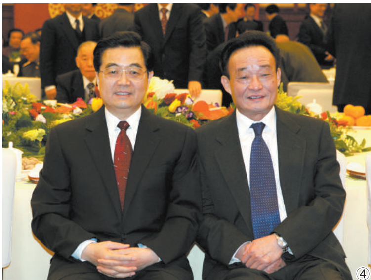
图④:二〇〇五年一月一日,全国政协在北京举行新年茶话会。这是胡锦涛同志与吴邦国同志在一起。