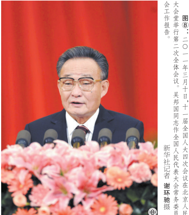
图⑧:二〇一一年三月十日,十一届全国人大四次会议在北京人民大会堂举行第二次全体会议。吴邦国同志作全国人大常委会工作报告。