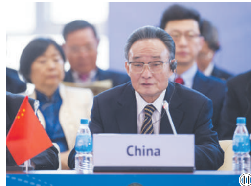
图⑪:2013年1月28日,吴邦国同志在俄罗斯符拉迪沃斯托克出席亚太经合组织第21届年会,并作题为《坚持和平发展 促进合作共赢》的主旨发言。