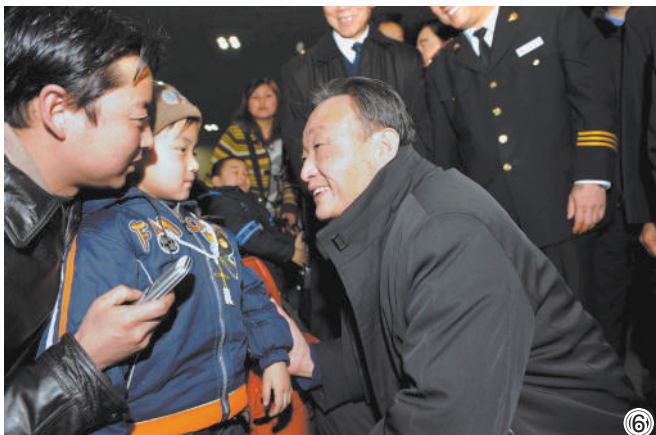
图⑥:2008年2月3日,吴邦国同志在北京西站候车室与旅客交谈。