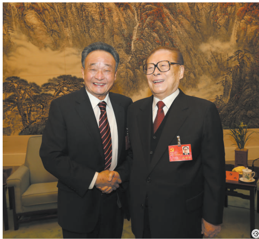
图③:2012年11月14日,中国共产党第十八次全国代表大会在北京闭幕。这是闭幕会前,江泽民同志与吴邦国同志在一起。