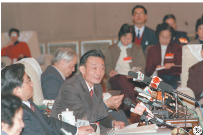
图⑤:1994年3月,时任上海市委书记的吴邦国同志在全国两会上上海代表团全团会议上。

吴邦国同志是中国特色社会主义民主法治建设的重要领导者。他强调,如果没有比较完备的、高质量的法律法规,就谈不上实现社会主义民主政治的制度化、规范化和程序化,就谈不上依法治国、建设社会主义法治国家。在党中央领导下,他将立法工作作为全国人大及其常委会的首要任务,紧紧围绕党中央确定的立法工作目标,坚持科学立法、民主立法,适应社会主义市场经济发展、社会全面进步和加入世贸组织的新形势,把中国特色社会主义法律体系中基本的、急需的、条件成熟的法律作为立法重点,抓紧制定修改相关法律,集中开展法律清理工作。2003年3月,他担任中央宪法修改小组组长,在中央政治局常委会领导下主持宪法修改工作。由十届全国人大二次会议通过的宪法修正案,确立了“三个代表”重要思想在国家政治和社会生活中的指导地位,明确国家尊重和保障人权、依法保护公民的私有财产权和继承权等内容,对促进我国经济社会发展、推进中国特色社会主义民主法治建设具有重要意义。在他的主持下,第十届、十一届全国人大及其常委会共审议通过宪法修正案草案、法律草案、法律解释草案和有关法律问题的决定草案186件,包括物权法、企业破产法、企业所得税法、公务员法、行政许可法、治安管理处罚法、劳动合同法、未成年人保护法、妇女权益保障法、关于加强网络信息保护的决定等。在党中央领导下,他主持制定反分裂国家法,把党和国家对台工作的大政方针和政策措施以法律形式固定下来,为反对和遏制“台独”分裂活动、促进祖国和平统一提供有力法律保障。他主持对香港特别行政区基本法、澳门特别行政区基本法及其附件有关条款作出解释并通过相关决定,推动两个基本法正确实施和“一国两制”方针贯彻落实。他主持制定修改一系列对中国特色社会主义事业发展具有重大影响的法律,为推动形成中国特色社会主义法律体系作出重要贡献。(下转第六版)