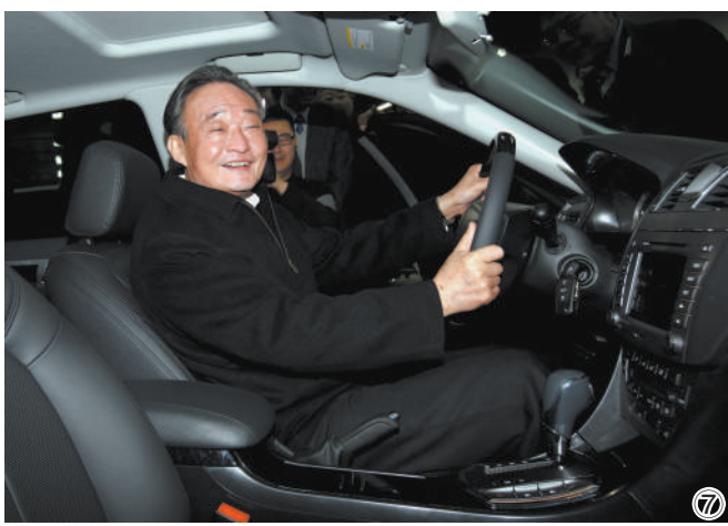
图⑦:2010年1月30日,吴邦国同志在上海汽车集团股份有限公司技术中心察看新能源车样车。