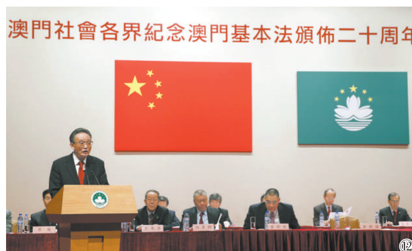
图⑫:2013年2月21日,吴邦国同志在澳门文化中心出席澳门社会各界纪念澳门基本法颁布20周年启动大会并发表讲话。