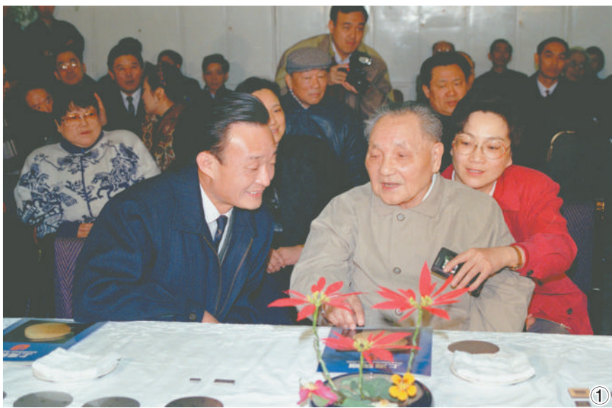
图①:1992年2月10日,邓小平同志在上海贝岭微电子制造有限公司参观时与吴邦国同志交谈。