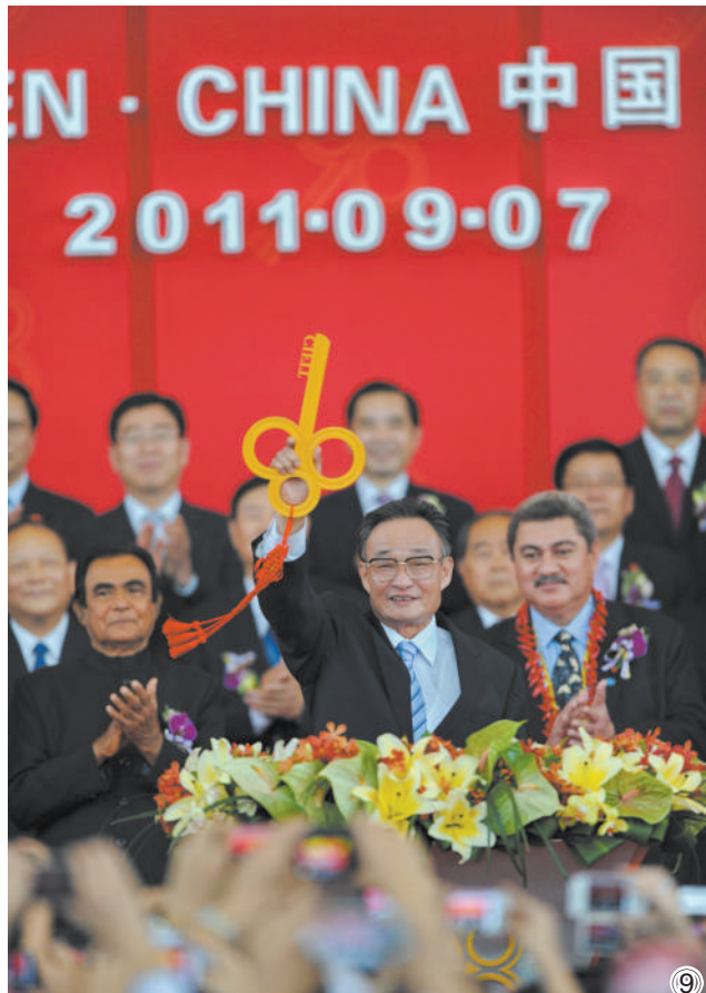
图⑨:二〇一一年九月七日,吴邦国同志在福建厦门出席第十五届中国国际投资贸易洽谈会开幕式。