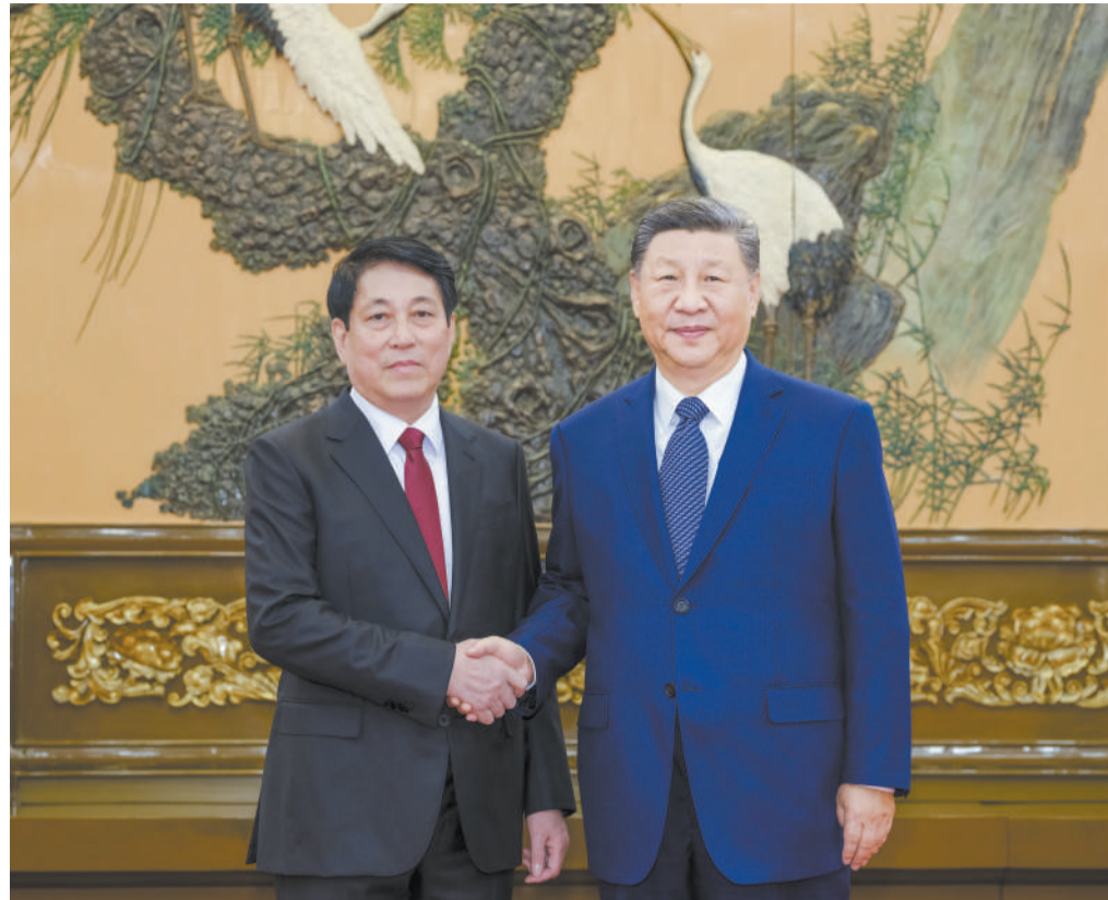
10月11日，中共中央总书记、国家主席习近平在北京人民大会堂会见越共中央政治局委员、中央书记处常务书记梁强。