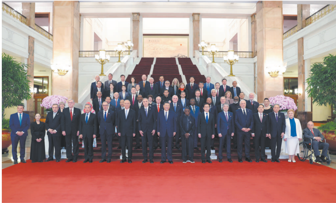
10月11日上午，国家主席习近平在北京人民大会堂集体会见出席中国国际友好大会暨中国人民对外友好协会成立70周年纪念活动的外方嘉宾。这是习近平同部分外方嘉宾代表合影留念。