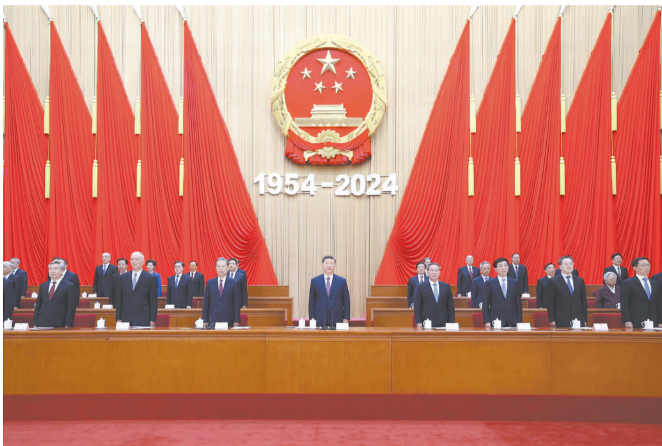
9月14日上午，中共中央、全国人大常委会在北京人民大会堂隆重举行庆祝全国人民代表大会成立70周年大会。习近平、李强、赵乐际、王沪宁、蔡奇、丁薛祥、李希、韩正等出席大会。

新华社北京9月14日电 中共中央、全国人大常委会14日上午在人民大会堂隆重举行庆祝全国人民代表大会成立70周年大会。中共中央总书记、国家主席、中央军委主席习近平出席会议并发表重要讲话。他强调，要进一步坚定道路自信、理论自信、制度自信、文化自信，发展全过程人民民主，坚持好、完善好、运行好人民代表大会制度，为实现新时代新征程党和人民的奋斗目标提供坚实制度保障。