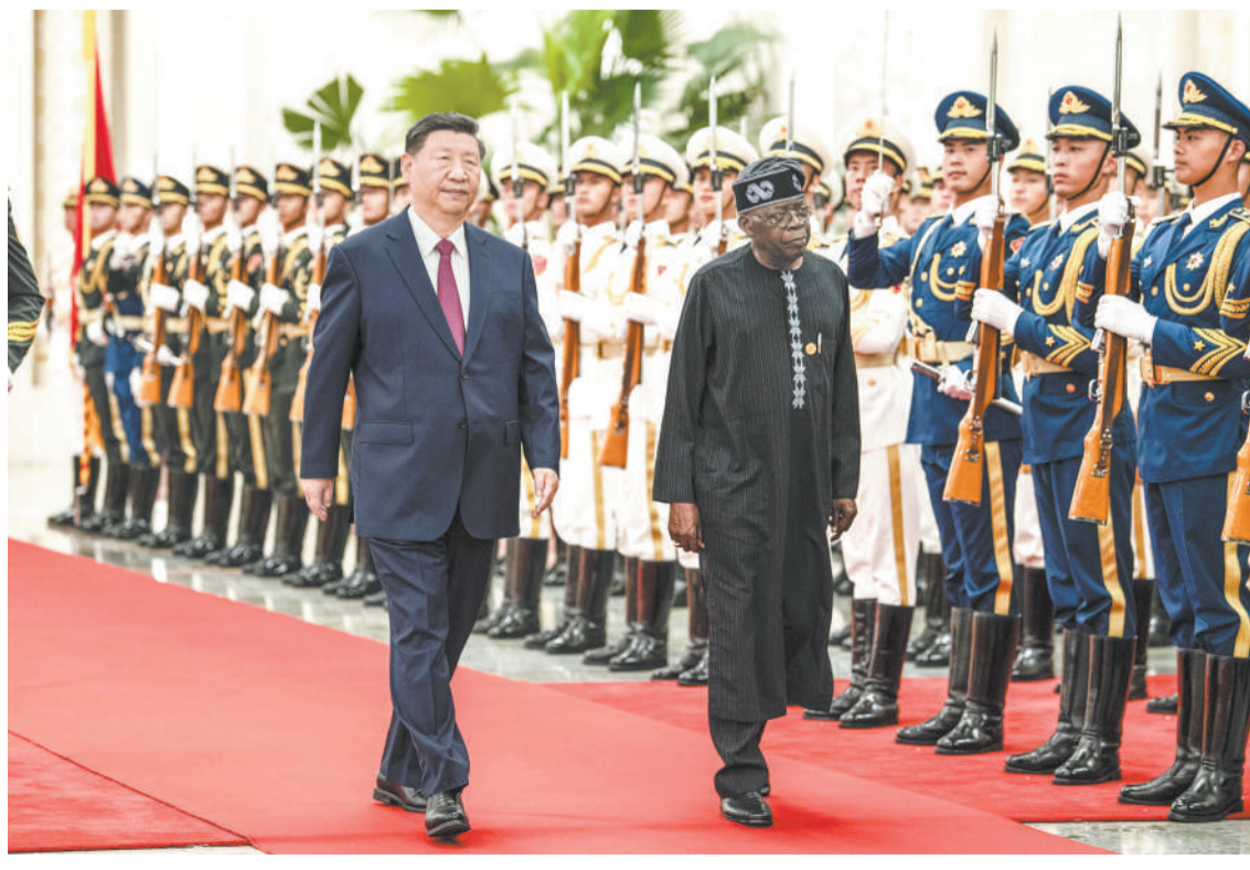
九月三日下午，国家主席习近平在北京人民大会堂同尼日利亚总统提努布举行会谈。这是会谈前，习近平在人民大会堂北大厅为提努布举行欢迎仪式。