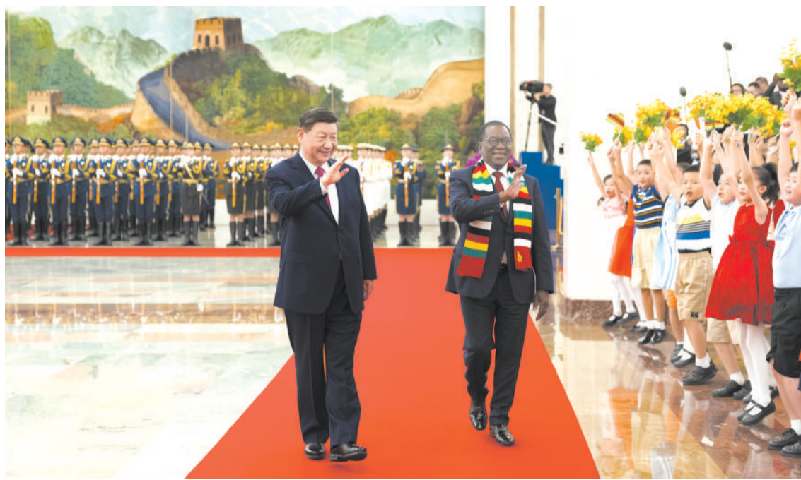
九月三日下午，国家主席习近平在北京人民大会堂同津巴布韦总统姆南加古瓦举行会谈。这是会谈前，习近平在人民大会堂北大厅为姆南加古瓦举行欢迎仪式。