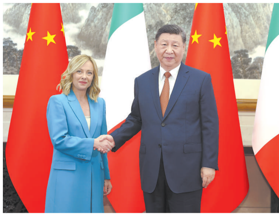
7月29日下午，国家主席习近平在北京钓鱼台国宾馆会见来华进行正式访问的意大利总理梅洛尼。