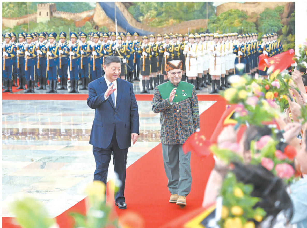
七月二十九日上午，国家主席习近平在北京人民大会堂同来华进行国事访问的东帝汶总统奥尔塔举行会谈。这是会谈前，习近平在人民大会堂北大厅为奥尔塔举行欢迎仪式。