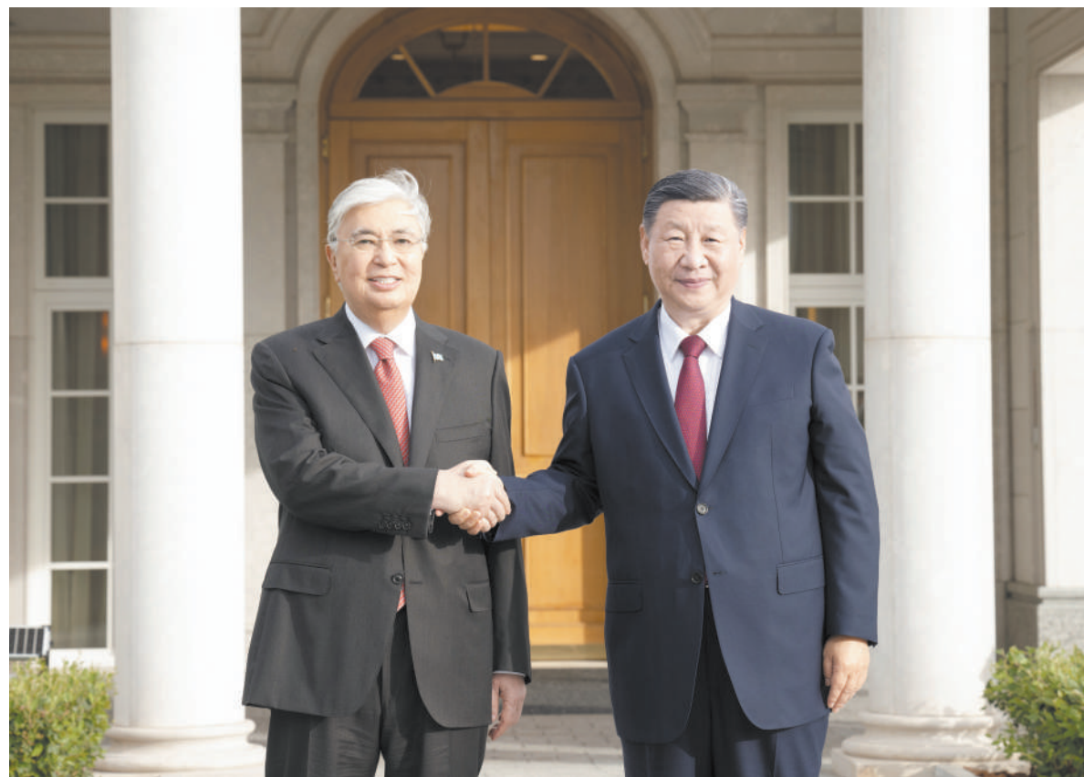
当地时间七月二日晚，国家主席习近平应邀同哈萨克斯坦总统托卡耶夫共进晚餐，在愉快温馨的环境中就中哈关系和共同关心的问题进行了亲切友好的交流。

新华社阿斯塔纳7月2日电 当地时间7月2日晚，国家主席习近平应邀同哈萨克斯坦总统托卡耶夫共进晚餐，在愉快温馨的环境中就中哈关系和共同关心的问题进行了亲切友好的交流。