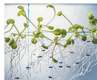
水中的拟南芥。

研究人员由此揭示了一种新机制,这种机制使生物体能够感知光的来源,以调整器官(如叶子)位置,进而优化光合作用。