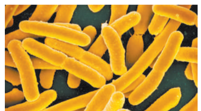
大肠杆菌的显微镜图像。

科技日报讯(记者刘霞)美国得克萨斯大学奥斯汀分校科学家发现,包括大肠杆菌在内的一些细菌,会利用铁含量的多少存储不同行为的信息,这些信息在对某些刺激的反应中被激活。研究显示,这些由铁产生的“记忆”至少持续了四代,到第七代就消失了。最新发现在预防和对抗细菌感染以及解决抗生素耐药性等方面具有潜在应用价值。相关论文发表于最新一期《美国国家科学院院刊》。