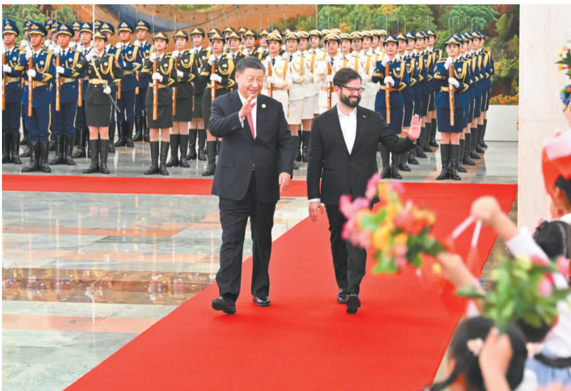
十月十七日上午，国家主席习近平在北京人民大会堂同来华出席第三届“一带一路”国际合作高峰论坛并进行国事访问的智利总统博里奇举行会谈。会谈前，习近平在人民大会堂北大厅为博里奇举行欢迎仪式。