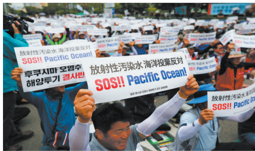
来自韩国的数千名渔民在首尔国会议事堂附近举行大规模集会，强烈反对日本福岛核污染水排海(资料图片)。