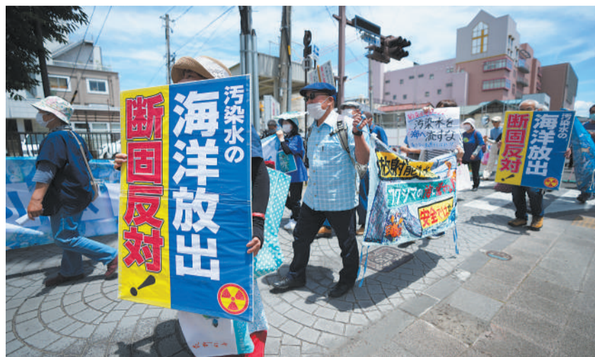
来自福岛当地及日本各地的民众在福岛市举行抗议活动，向福岛县政府表达坚决反对福岛核污染水排海的立场(资料图片)。