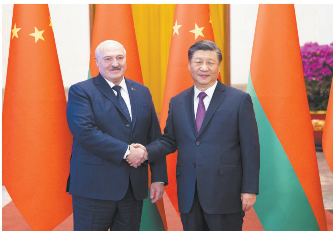
三月一日,国家主席习近平在北京人民大会堂同来华进行国事访问的白俄罗斯总统卢卡申科举行会谈。这是会谈前,习近平在人民大会堂北大厅为卢卡申科举行欢迎仪式。