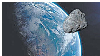
可能每隔10年,地球就会迎来一颗来自其他星系的访客。

的流体,能毫无阻滞地在子星内部运动。研究团队的模拟解释了其中一些场景,他们希望未来能将最新研究与LIGO和其他探测器即将开展的测量(将探测到更详细的引力波频率)进行比较,以进一步揭示中子星的秘密。