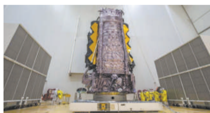
12月11日,韦伯太空望远镜安放在阿丽亚娜5号火箭顶部。

科技日报北京12月20日电(记者刘震)据物理学家组织网近日报道,美国国家航空航天局(NASA)局长比尔·纳尔逊近日证实,詹姆斯·韦伯太空望远镜(以下简称韦伯太空望远镜)将于12月24日在法属圭亚那的欧洲太空港由阿丽亚娜5号火箭发射升空。该望远镜由NASA、欧洲航天局和加拿大航天局共同研发,被称为这个十年中人类观察宇宙的理想平台。