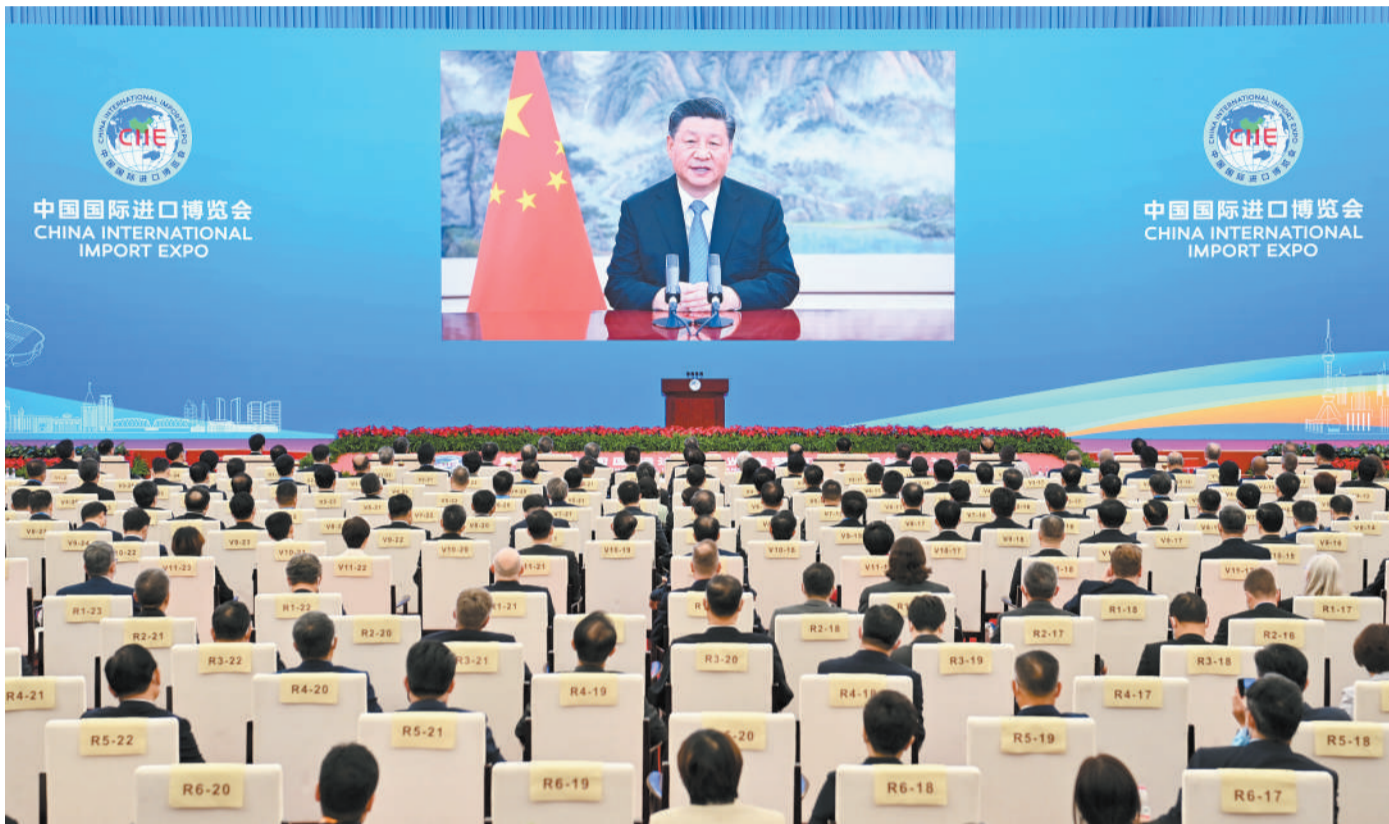
11月4日晚，国家主席习近平以视频方式出席第四届中国国际进口博览会开幕式并发表题为《让开放的春风温暖世界》的主旨演讲。

新华社北京11月4日电 11月4日晚，国家主席习近平以视频方式出席第四届中国国际进口博览会开幕式并发表题为《让开放的春风温暖世界》的主旨演讲。(演讲全文另发)