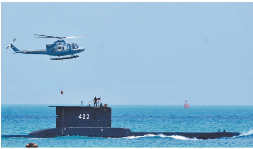
2017年10月5日在印度尼西亚万丹拍摄的涉事潜艇的资料照片。

与“南加拉”号同样年长的姊妹船“卡克拉”号(Cakra)最近正在接受全面改装和关键部件的更新,但由于其已投入使用40年,印尼海军可能会要求其退役,以尽量减少再次发生事故的可能性。