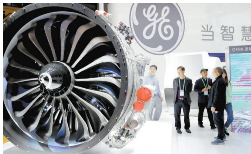
11 月 5 日，首届中国国际进口博览会在国家会展中心（上海）拉开帷幕。图为参观者在美国通用电气公司生产的飞机发动机模型旁驻足。新华社记者 方喆摄

国家贸易投资综合展是首届中国国际进口博览会的重要组成部分，共有 82 个国家、3 个国际组织设立 71 个展台，展览面积约 3 万平方米。印度尼西亚、越南、巴基斯坦、南非、埃及、俄罗斯、英国、匈牙利、德国、加拿大、巴西、墨西哥等 12 个国家为主宾国。丁薛祥、李强、杨浩捷、胡春华、黄坤明、王毅、赵克志、何立峰等参加上述活动。