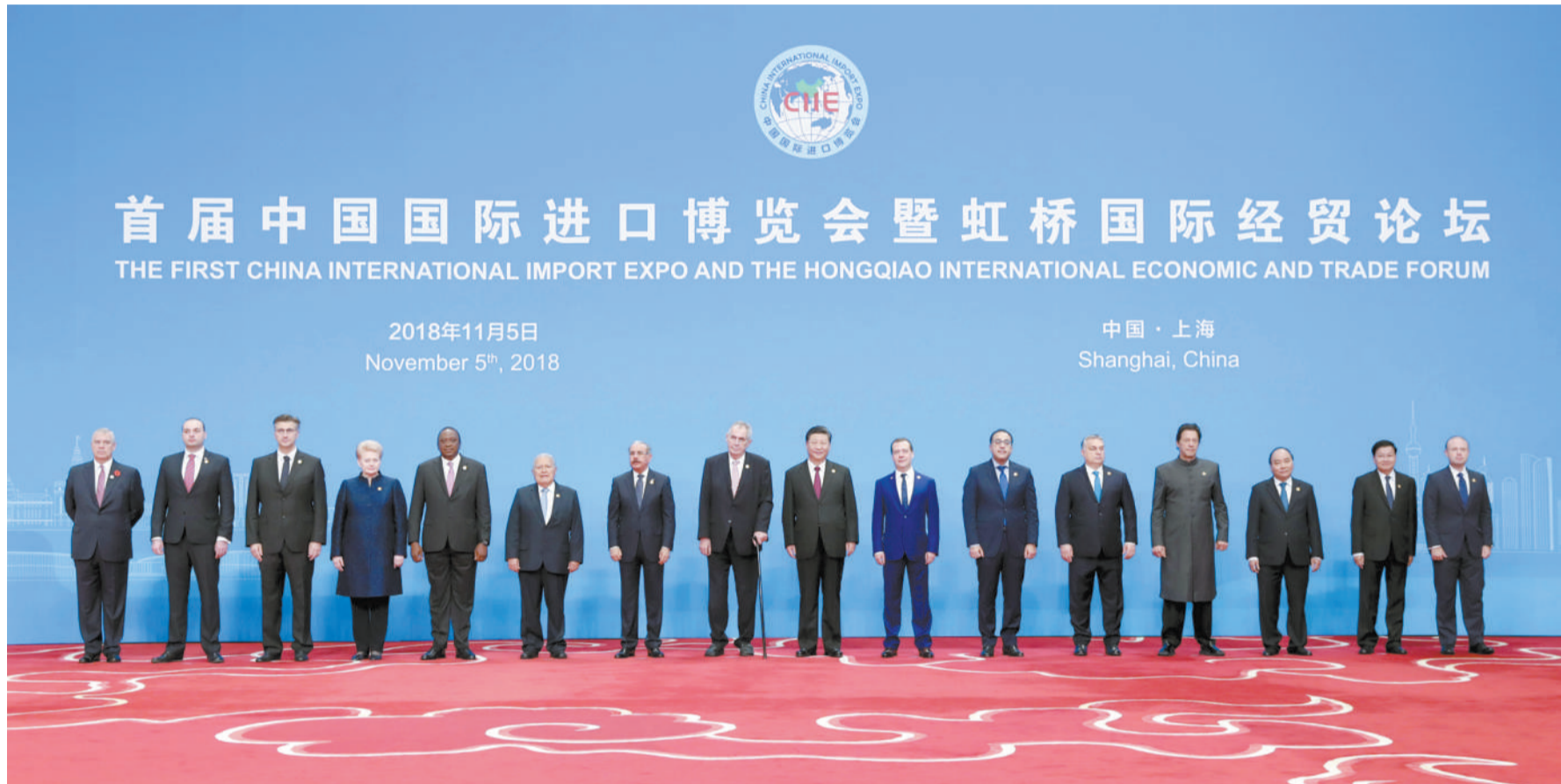
首届中国国际进口博览会开幕式前，习近平同外方领导人集体合影。

新华社上海 11 月 5 日电（记者姜薇白洁 刘红霞）首届中国国际进口博览会 5 日在上海开幕。国家主席习近平出席开幕式并发表题为《共建创新包容的开放型世界经济》的主旨演讲，强调回顾历史，开放合作是增强国际经贸活力的重要动力；立足当前，开放合作是推动世界经济稳定复苏的现实要求；放眼未来，开放合作是促进人类社会不断进步的时代要求。各国都应该积极推动开放合作，实现共同发展，开创人类更加美好的未来。中国推动更高水平开放的脚步不会停滞，推动建设开放型世界经济的脚步不会停滞，推动构建人类命运共同体的脚步不会停滞。