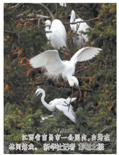
红河会商南甯市一公园内,白鹤在林中嬉戏。

另悉,澜湄跨境野生动物保护对话机制将于3月28日举行第一次正式会议,讨论并确定机制下具体合作的开展。