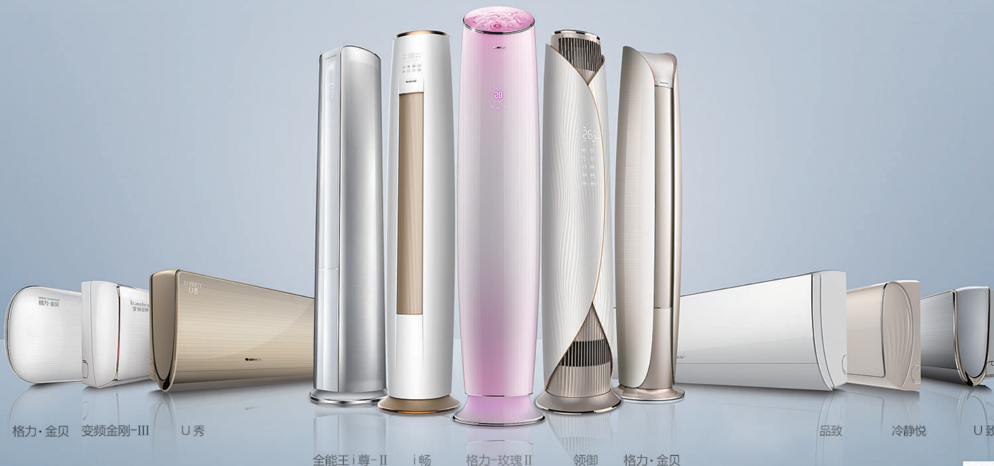
格力·金贝 变频金刚-III U秀

Gree, Created in China, Loved by the World