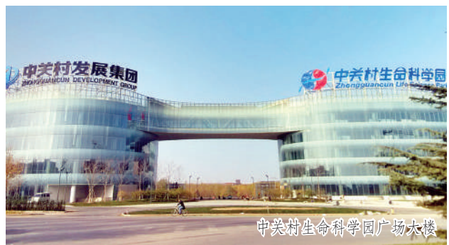
中关村生命科学园广场大楼