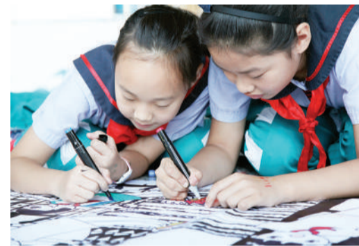
9月17日,江苏省南京市,梅山一小的同学们在绘制科幻画。