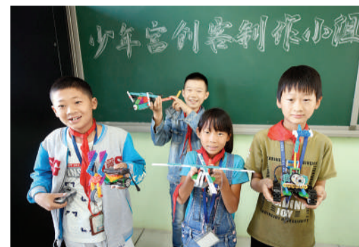
9月19日,在河北省大厂回族自治县邵府中心小学,孩子们在展示组装好的机器人。