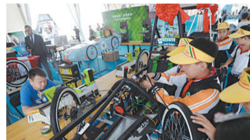
9月18日,在刚刚开幕的北京科学嘉年华上,第四互动体验区“创客汽车城”里,一群小学生正在埋头设计和组装新能源汽车。