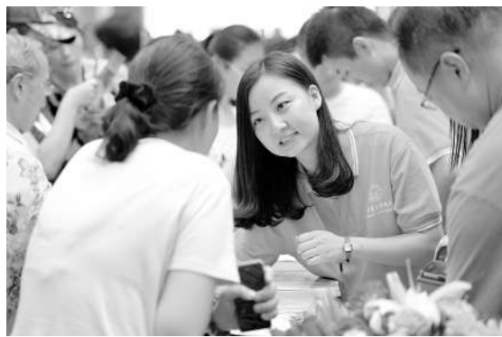
6月26日,陕西高等教育博览会暨招生咨询会上高校代表向考生家长介绍学校招生信息。

当日,“2016第六届陕西高等教育博览会暨招生咨询会”在西安曲江国际会展中心开幕,来自全国各地的400余所高校和教育机构将在3天时间里为考生和家长提供招生咨询服务。