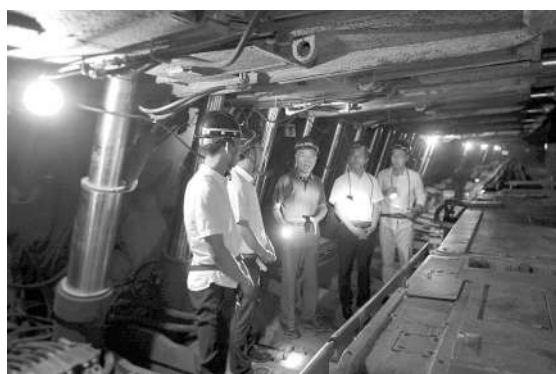
6月26日,在“教学矿井”的采煤工作面,指导老师(中)在为运城职业技术学院的学生们介绍采煤技术。

为了培养涉煤专业学生的职业素养和技能,山西省运城职业技术学院把课堂搬入“教学矿井”。在井下,学生们系统地学习采煤工艺流程和安全生产知识。