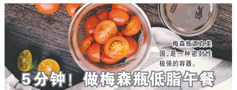
梅森瓶源自美国,是一种密封性极强的容器。