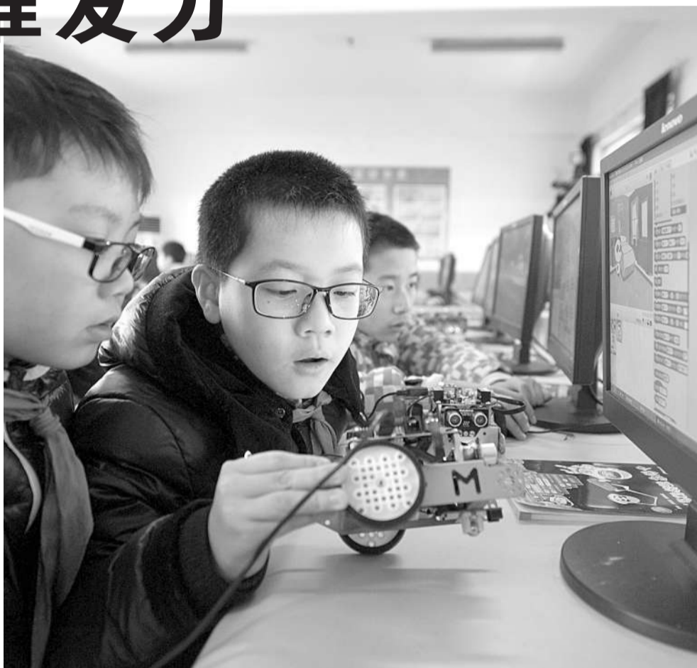
1月5日,浙江省湖州市长兴县第一小学的“创客”课堂里,学生们正在通过计算机编程控制一旁的机器人。

“今年中国的教育也进入到‘十三五’的背景之下,在这个大方向上,创客教育无疑具有重要的