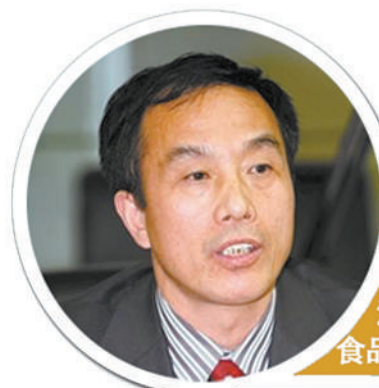
金征宇 全国人大代表 江南大学副校长、教授 食品科学国家重点实验室主任