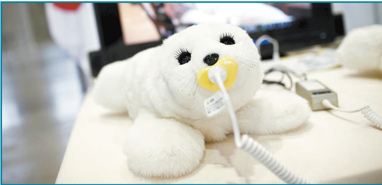
西班牙马德里举行国际机器人博览会,各色机器人争奇斗异,吸人眼球。