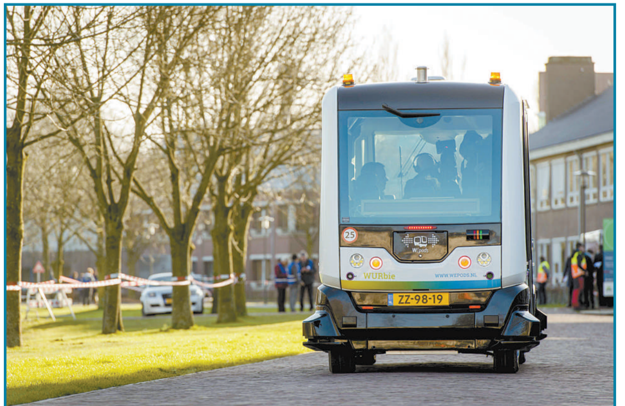
全球首辆无人驾驶摆渡车WePod无人驾驶汽车在荷兰瓦赫宁根大学校园中行驶。这款名为WePod的电动汽车可搭载6名乘客,运营路线长度只有200米,时速为8公里。