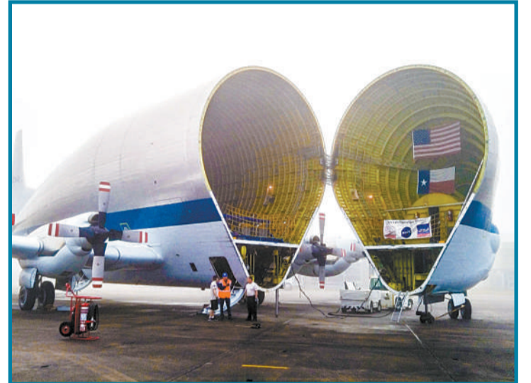
▼2月1日,美国宇航局“超级古比鱼”运输机将运送美国宇航局的“猎户座”太空飞船压力舱前往佛罗里达肯尼迪航天中心。