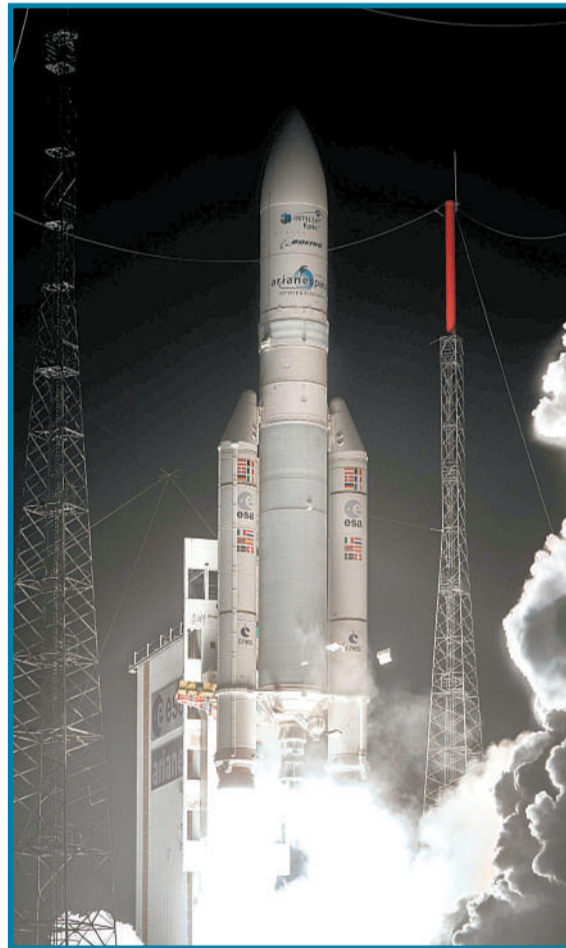
1月28日,欧洲阿丽亚娜航天公司的一枚阿丽亚娜5型火箭从法属圭亚那库鲁航天中心发射,成功将一颗通信卫星送入轨道。