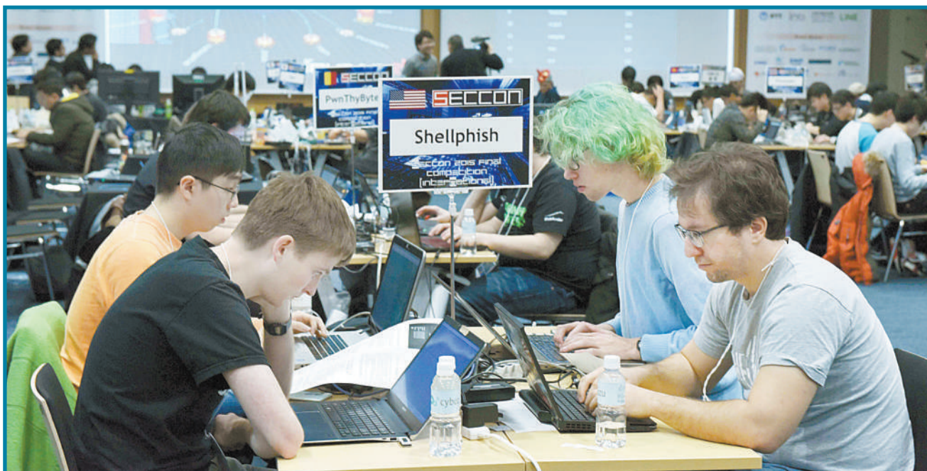
1月31日,日本东京,来自日本、罗马尼亚、俄罗斯、韩国、泰国、美国等国家地区的18个团队的70名选手参加2016安全竞技大赛决赛。