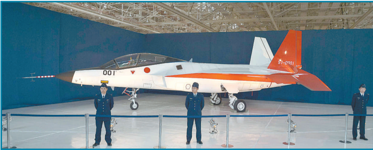
日本国产隐形战机试验机。为了让具有隐形功能的战机国产化,日本政府将于2月中旬进行“心神”战机的首次试验飞行。