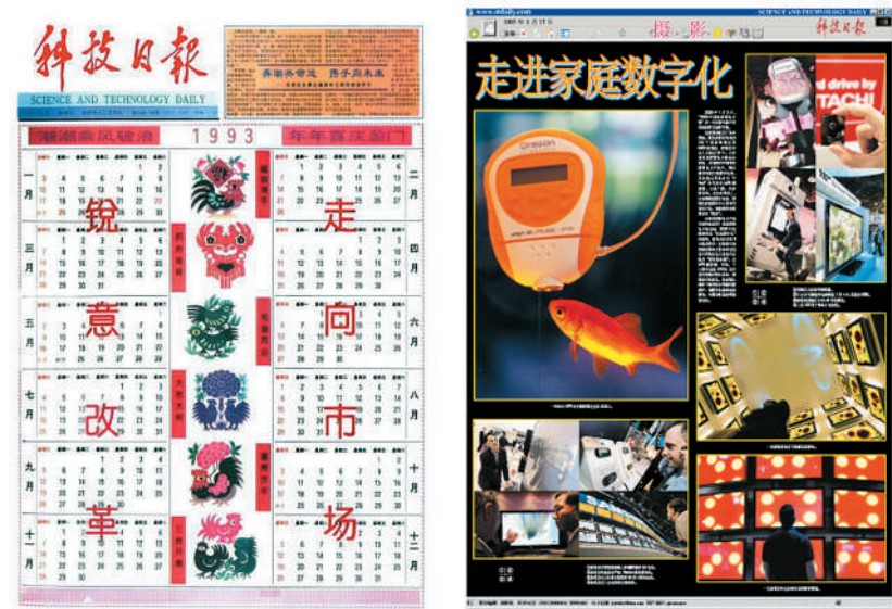
中国大陆第一张激光照片彩报 科技日报1993年1月1日刊