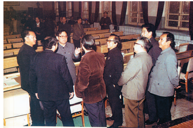
宋健亲切会见《中国科技报》领导班子