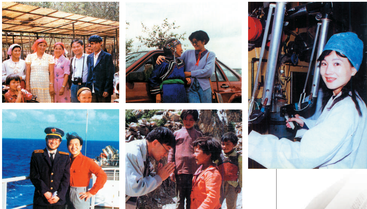
在路上,在别处,在身边