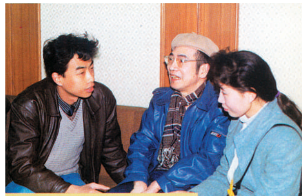
陈景润接受本报记者采访