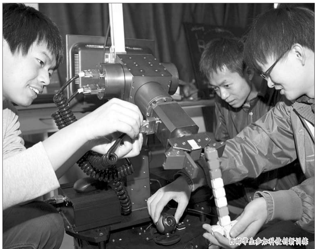
西邮学生参加科技创新训练

远程在线监测仪。为了使产品能够尽快投入市场,他们积极尝试校企合作新模式,先后与青岛佳明测控科技股份有限公司、陕西三环环境工程集团有限公司、榆林环境保护工程有限公司和博康电子有限公司等多家企业建立友好合作关系。他们最新研发出的便携式水质远程分析仪样机和便携式蟹池智能决策仪样机,现阶段正在进行大力推广。