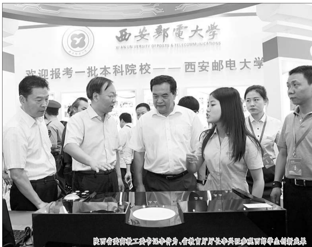
陕西省教育工委副书记李中为、省教育厅厅长李兴胜参观西邮学生创新创业成果

西安邮电大学“大学生创新创业孵化基地”以扶持大学生自主创新创业项目为核心目标,为在校大学生提供自主创业以及科技创新的政策、场地和资金环境,从而培养一批全面发展的创新创业者。大学生创新创业孵化基地分为校、院两级。校级孵化基地占地约230个平方米,划分为10块团队入驻孵化区域和1个小型会议室。学校在全校招募优质的创新创业项目,重点打造“技术服务型”、产品开发型、商业服务型”三种类型的创新创业项目,主要包括实体公司、虚拟公司、科研立项项目。对于成功入驻孵化基地的项目,学校会提供充分的条件和全方位的服务。学校为获批的创新创业团队提供一年的免费孵化场地,免费为每个入驻项目提供办公设施,包括电脑、网络、办公桌椅等。更为重要的是,学校还对获批的创新创业团队提供有力的资金支持,有包括“西安邮电大学大学生创新创业基金”、“西安邮电大学科技处学生科技创新基金”等在内的各项资助,“创新创业基金”从4000至6000元不等,而“学生科技创新基金”则高达3万元。此外,学校还会为创新创业优秀团队提供校外孵化器、创新创业成长导师以及宣传推介等服务。