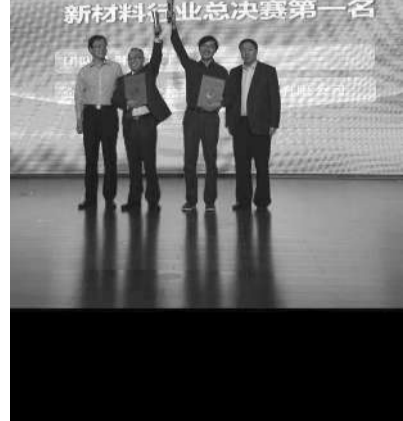
首届众创杯中国北京创新创业大赛新材料、新能源及节能环保主题赛决赛