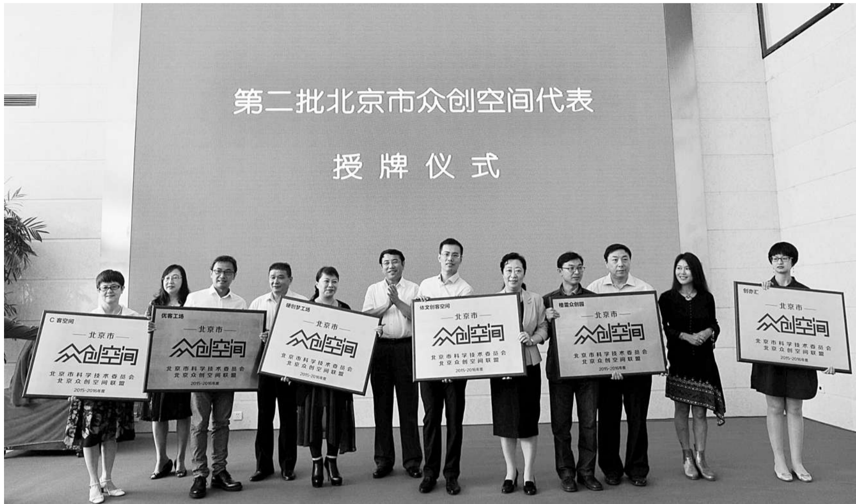
第二批北京市众创空间授牌

清华经管创业者加速器同样是此次被授予“北京市众创空间”称号的机构之一。这个由清华经管学院成立的创业者加速平台,于2015年1月31日正式启动。清华经管创业者加速器依托清华大