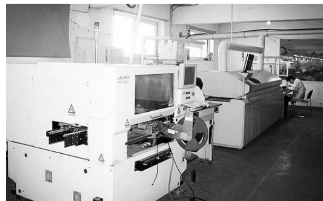
中关村智能硬件梦工场硬件加工平台