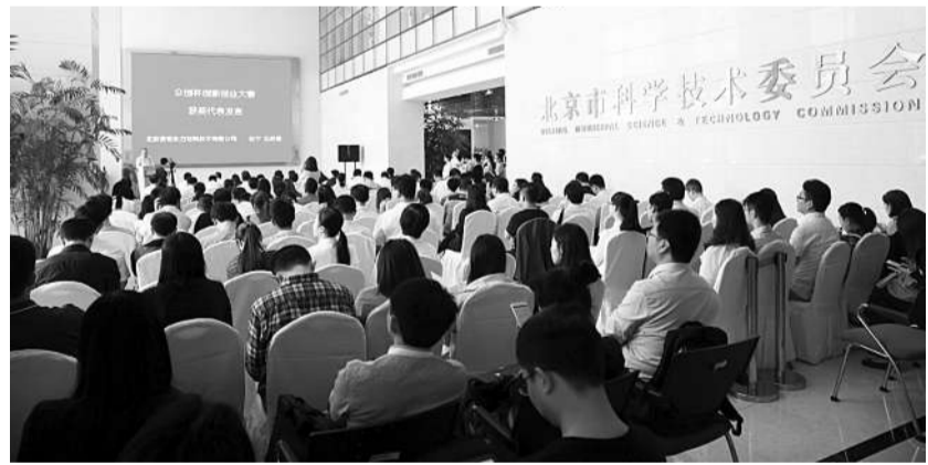
众创杯创新创业大赛获奖代表发言