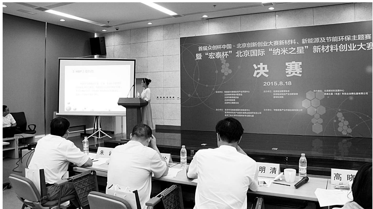
首届众创杯中国北京创新创业大赛新材料、新能源及节能环保主题赛决赛