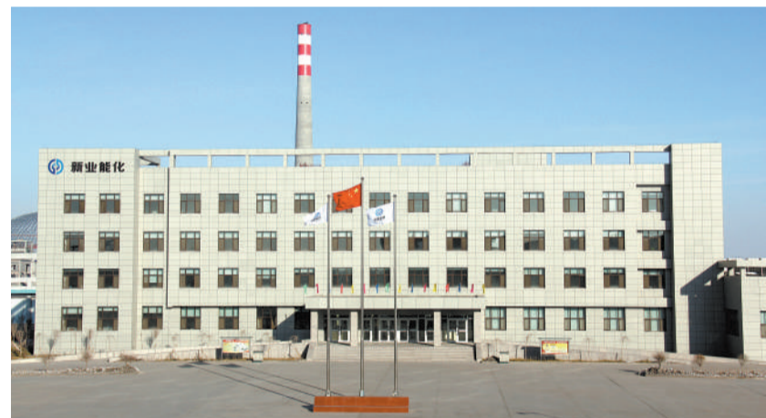
新疆新业能源化工有限责任公司办公楼