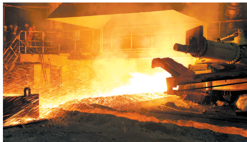
新疆昆仑钢铁有限公司炼钢车间