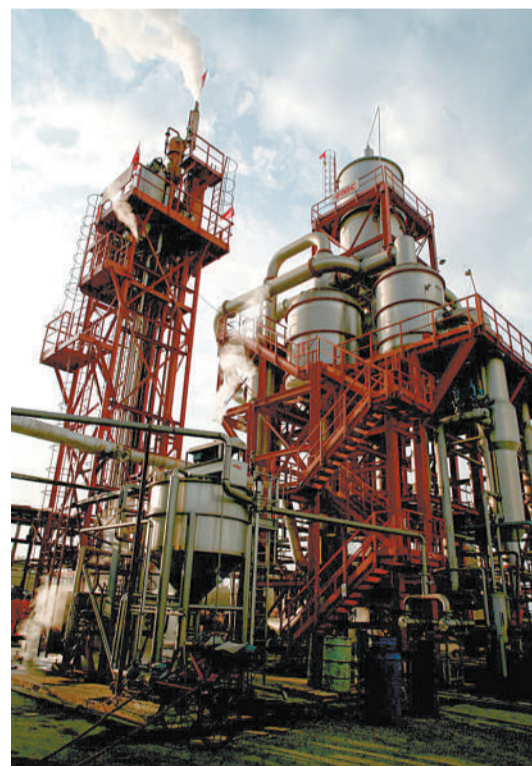
新疆鸿基焦化有限责任公司厂区一角