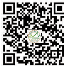
新疆五家渠经济技术开发区官方微信

为鼓励中小企业来五家渠投资创业,2014年,经第六师五家渠市政府批准,由五家渠经济技术开发区管委会所属建设投资公司开发建设中小企业创业园(以下简称创业园)。创业园占地面积2055亩,主要规划建设130栋标准厂房和29栋综合配套用房,建筑面积分别为79万平方米和15万平方米,总投资25亿元,2014年开始动工,分三期开发建设。