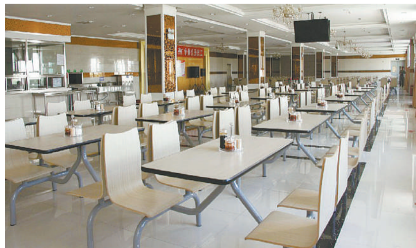
新疆华春毛纺有限公司职工餐厅