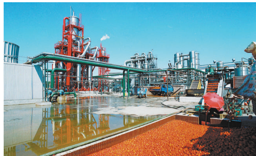
新疆中基蕃茄制品有限公司厂区