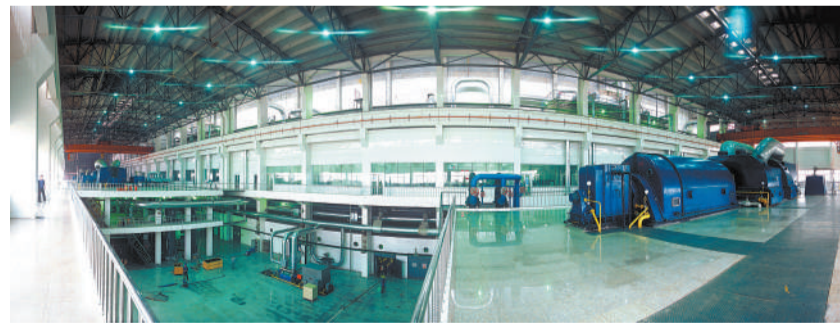
新疆六师煤电有限公司热电厂车间