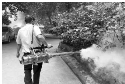
截止到9月26日零时,广东省共报告9161例登革热病例,针对登革热疫情高发的情况,广州近期在全市加大灭蚊力度。9月27日,工作人员在广州越秀区东兴小区内喷洒灭蚊药。