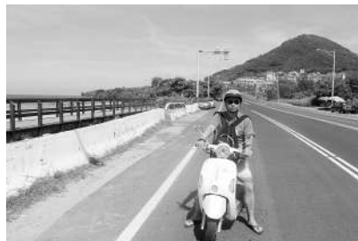
从绝大多数国人“足不出县”,到今天走出家门、走出国门;从公共节假日拥挤出游,到择日休闲度假……旅游半径的扩大和旅游理念的转变,见证着65年间国人生活水平的提升。