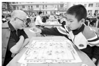
9月27日,河北省邯郸市老年人体育协会主办的迎重阳“大手拉小手”中国象棋友谊赛在邯郸市绿化路小学举行,现场100位老年人与100名小学生同台博弈,享受象棋运动的乐趣。