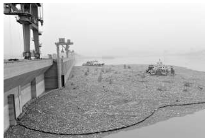
长江三峡集团公司与湖北秭归一家水泥公司合作,共同研发出水泥窑协同处理漂浮物生产线,使三峡漂浮物变身成为“新能源”,为解决三峡库区水面漂浮物处理难题拓宽了思路。