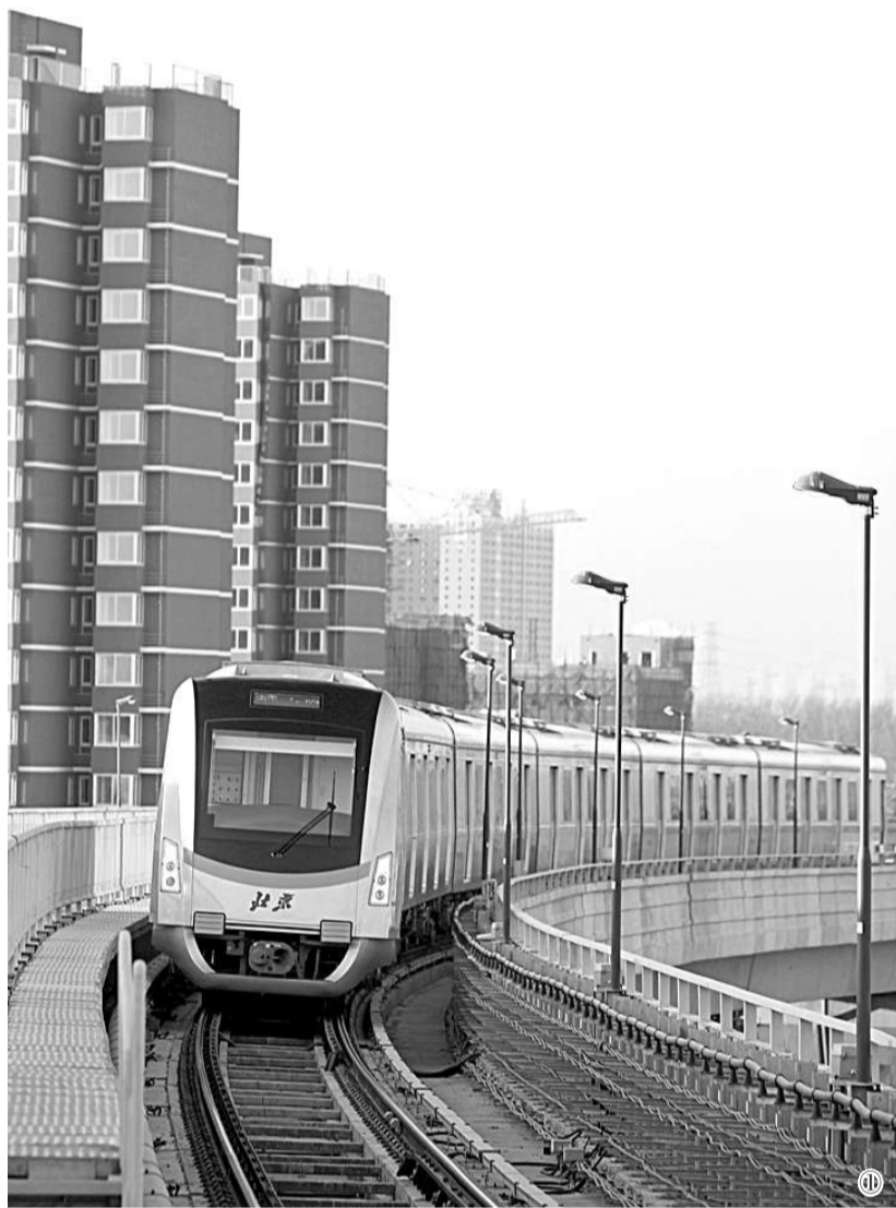
①轨道交通昌平线 ②昌平未来科技城 ③在昌平举办的北京农业嘉年华内的蔬菜森林展区 ④昌平新城滨河森林公园 ⑤居庸关长城全景

未来科技城,是昌平“三城一区一基地”中的一城。“三城一区一基地”还包括沙河大学城、昌平新城、北京科技商务区(TBD)以及国家工程技术创新基地。如今,北京科技商务区(TBD)正在加快建设,重