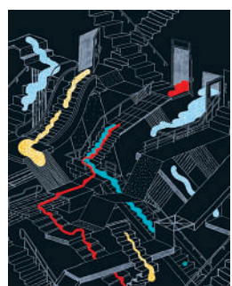
宇宙大爆炸之前存在着什么?

笔者曾在不止一位科学家的回忆录或传记里见到“科学是美的”这种说法,假如由追求美的艺术家们与科学家通力合作,创作一部艺术与科学交叉、别具一格的科普书籍,会是什么模样呢?大概就是眼前这本《哪儿,为什么,如何:75位画家为科学惊世之迷配图》了吧。 这本书的形式,是由若干科学工作者来解答75个问题,在每篇科普短文之后,再配上一幅画作。该书题材的选择是“无从驱使发现”和“惊奇推动科学”的最佳例证。 任何一位读者应该都会在75个主题中找到自己感兴趣的内容,比如“什么是反物质?”“地震能否预测?”“为什么每一朵雪花都独一无二?”“我为什么打哈欠?”“松鼠记得它们藏坚果的地方吗?”“癌是生物学上不大可能发生的事件,怎么还会如此常见?”“为何人类与大猩猩拥有着几乎相同的DNA,却长得如此不同?”等等。 撰写科普短文的作者大多用于博士或教授的头衔,是各自研究领域的佼佼者。而为文章配图的画家之中,也不乏丽莎·康顿、杰玛·科雷尔、乔恩·克拉森这些在北美颇有名的插图艺术家。 读过这本书的人大概会被创作者的心意给打动,觉得确实买得物有所值。纵观各大网络书店,读者评价普遍很好,难怪在2013年TED书店推荐的10本好书中有这本书的身影。除却“我们为什么要睡觉?”之类的问题,书中提出的多数问题都能调动起读者的兴趣,让大家有读下去的动力;科学解释的部分言简意赅,往往只有一两百字,而搭配的插图又兼具趣味与美感。 以笔者之见,为本书撰文的那些科学工作者的写作手法很值得国内的科普工作者学习。如本书第20页上,费米国立加速器实验室的科学家Brian Yanny在解释“任何物质能逃离黑洞吗?”这个问题