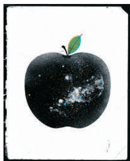
地心引力是如何工作的?