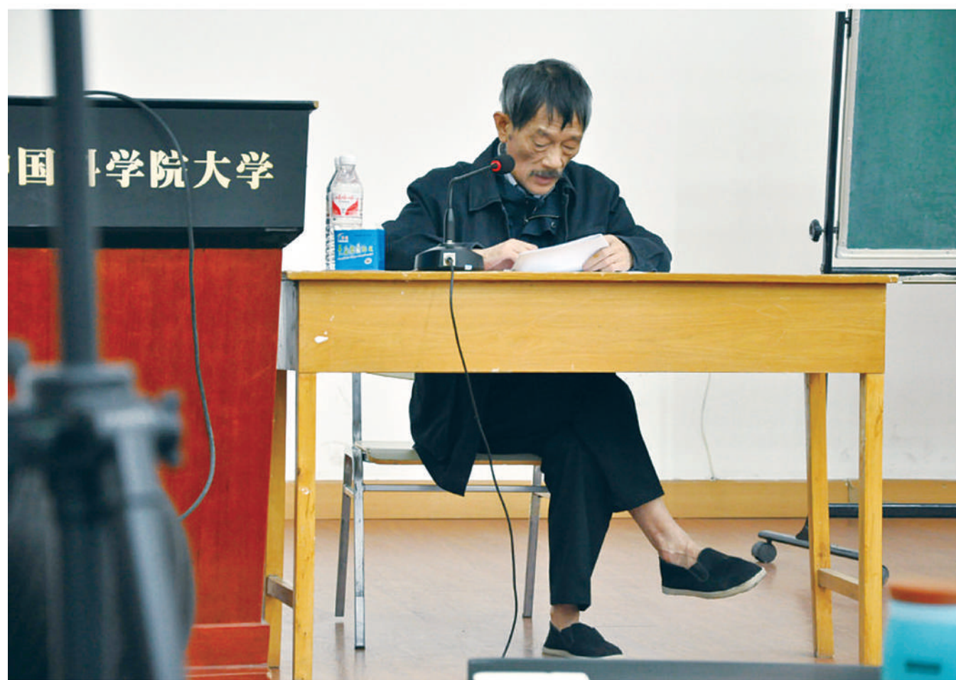
李小文,中国科学院院士,北京师范大学遥感与地理信息系统研究中心主任,地理学与遥感科学学院教授、博士生导师。

2011年,国际旅客列车境外换轮由同期3条增至9条,该技术攻关组开出"药方":制作"距地面20公分的轮轴轴箱组装平台"、制定《客车换轮场与客列检质量互控制度》,及每隔两月进行一次全列轴箱开盖检查等。"药方"开出两年间,因轴温高的境外换轮问题没再发生过,有效保证了国际客车安全运行和国际声誉。