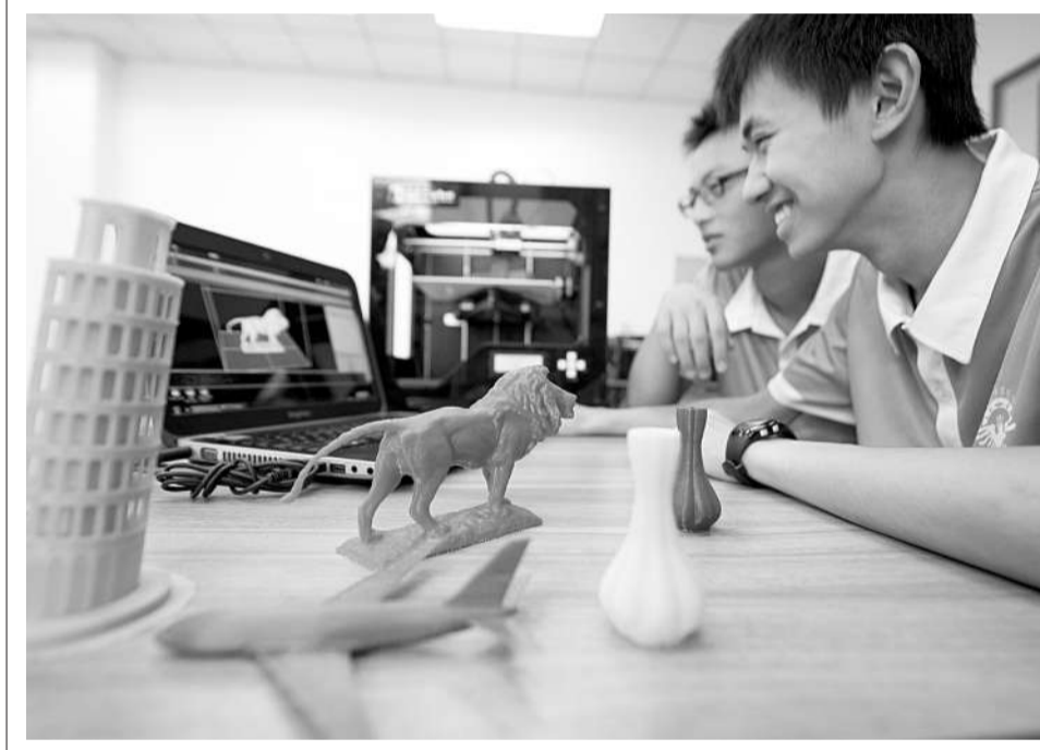
6月16日,北京市中小学首个3D打印实验室落户北京二中亦庄学校,北京紫照科技发展有限公司向实验室捐赠10台DM Cube桌面式3D打印机用于学生创新制作。上图为学生们观看3D打印机工作。下图为学生们利用电脑和3D打印机打印自己设计的模型。