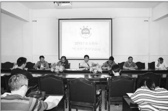
为提高师资水平，资源中学开展新老教师“传帮带”结对子活动