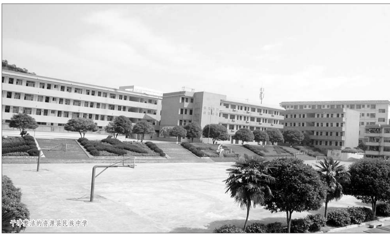
干净整洁的资源县民族中学

——为顺利推进免费普及高中阶段教育，资源县在财政相当困难的情况下，共投入前期资金4000多万元，用于资源中学、县民族中学的教育教学设备和基础设施建设等。投资1500万元用于修建资源中学教学楼、学生宿舍楼，总建筑面积10500多平方米；投资300万元用于改造资源中学校园内综合运动场，总面积8000余平方