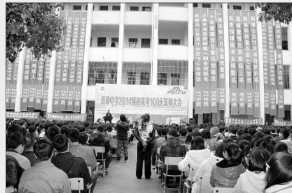
资源县资源中学2014届迎高考100天誓师大会