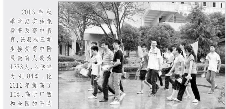
享受免费普及高中教育的高一新生带着入学通知书到校报名

把教育摆在优先发展的地位，把眼光放在提高全县全民整体素质上，资源县的教育呈现出意气风发、繁荣发展的生动局面，正在开启资源县的美好未来。