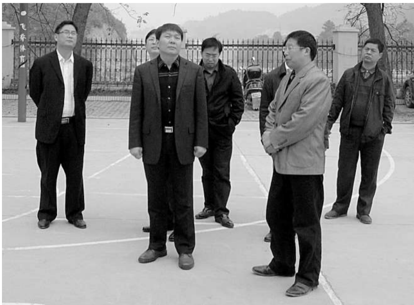
广西资源县委书记文飞(前中)深入学校调研免费普及高中和改善学校基础设施工作

——免费普及高中阶段教育，有利于推动青少年的健康成长。资源县地处山区，家长常年在外打工，文化水平不高，导致孩子对社会认识不够，刚读完九年制义务教育的孩子年纪尚小，步入社会如果没有正确引导，很容易误入歧途。普及高中阶段教育，可以使初中生通过高中阶段的学习，思想更加成熟，知识更加丰富，培养他们正确的人生观、世界观。“孩子多接受一天的教育，就少一分犯罪的危险。我们的初衷是让学生在求学留校久一点，可以更成熟地走向社会，更稳健地选择自己的人生，这对他们的个人