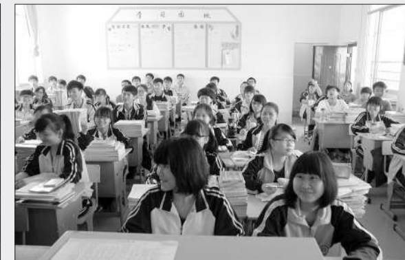
享受免费普及高中教育的学生正在与老师互动上课

2013年秋季学期实施免费普及高中教育，该县初三学生接受高中阶段教育人数为1373人，入学率为91.84%，比2012年提高了10%，高于广西和全国的平均水平。