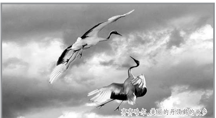
齐齐哈尔，美丽的丹顶鹤的故乡