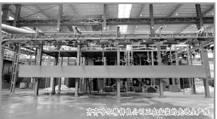
齐齐哈尔精铸良公司正在安装的先进生产线