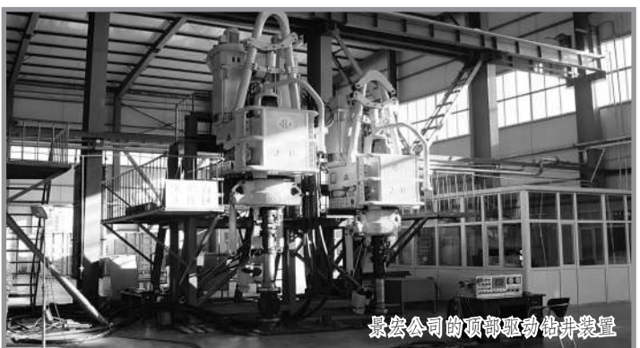
聚宏公司的顶卸移动式井架装置