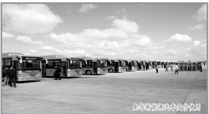
龙沙新能源汽车交付使用