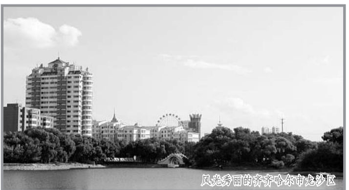
风光秀丽的齐齐哈尔市龙沙区

齐齐哈尔市龙沙区中小企业集中发展园区 经齐齐哈尔市城市规划委员会批准，2012年9月在齐齐哈尔市龙沙区五福玛村辟建中小企业集中发展园区。园区规划总面积95.29万平方米，东至百泰街，西至兴华路，北至大民路以北40米。土地性质为集体所有，企业以联营联建形式入驻。 目前累计投入4100万元，完成20万平方米土地的征收和整理、3条道路土石工程、园区广场和350米电缆工程，已吸纳德旺彩钢、鸿源钢化玻璃、永裕饲料、洋超绿色食品、华宝新型环保墙体材料、山鹰食品公