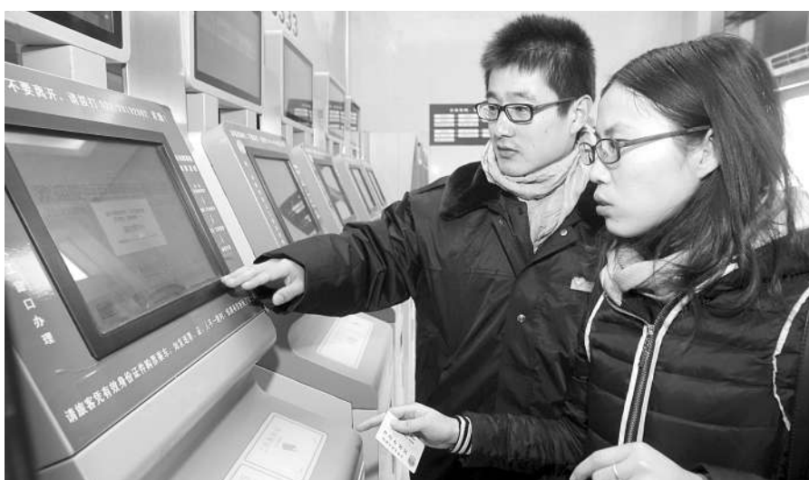
1月10日,一名大学生志愿者(后)为乘客讲解自助售票机的使用方法。当日,天津铁道职业技术学院的30名大学生作为天津铁路春运的首批志愿者,在天津站正式走上志愿服务岗位。