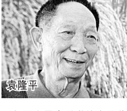
历年国家最高科学技术奖获得者