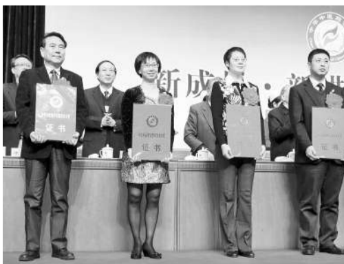
“消渴丸的现代研究与应用”课题获得“2013年度中华中医药学会科学技术奖一等奖”。图为广州白云山一药业有限公司科研负责人(前排左二)在领奖。

2013年11月16日,中华中医药学会2013年学术年会在北京会议中心隆重举行,会上“消渴丸的现代研究与应用”荣获中华中医药学会科学技术奖一等奖。