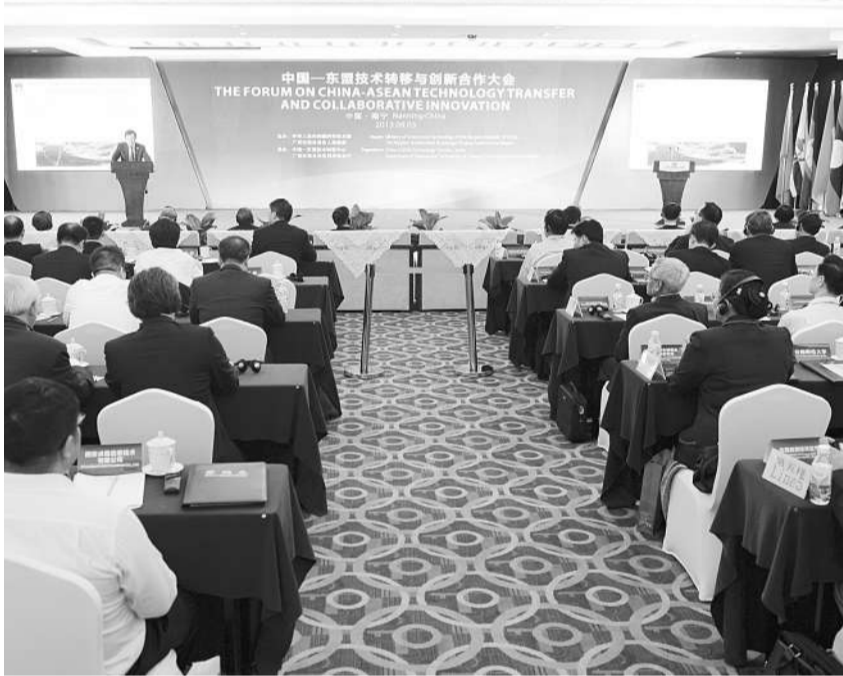
9月3日,中国—东盟技术转移与创新合作大会开幕式暨高层论坛在广西南宁召开。