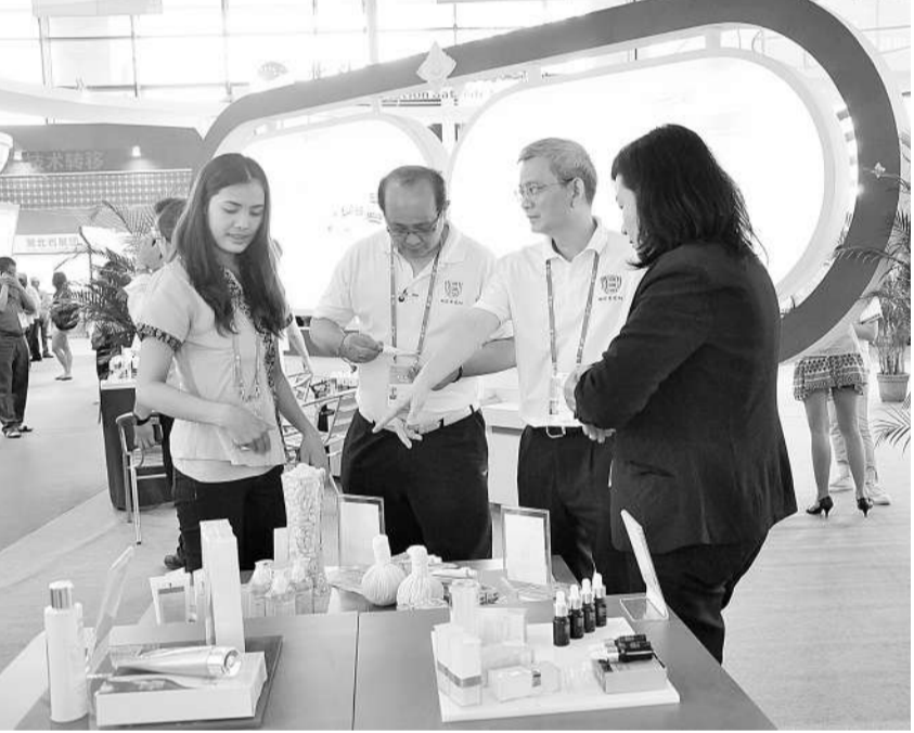
第十届中国—东盟博览会先进技术展重点突出东盟元素。图为泰国科技部展位。