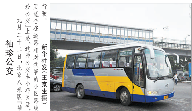
更适宜在道路狭窄的小区路段行驶。这种公交车小巧灵活,九月二十二日,北京八米版“袖珍公交”上路。