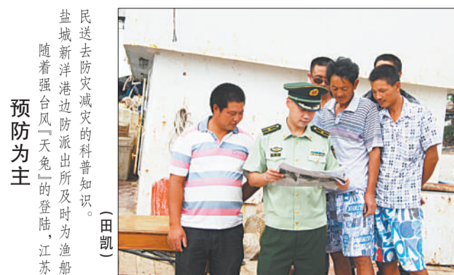
民送去防灾减灾的科普知识。(田凯) 盐城新洋港边防派出所及时为渔船