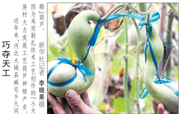
图为采用新技术制作的“小天鹅”房村大力发展工艺葫芦种植产业。近年来,河北大城县减屯乡九间村,由中铁五局集团电务