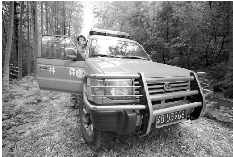
海能达为江苏宜兴林业打造大型防火指挥调度网,图为林管管理人员在使用新型对讲机。

在专网通信模转数的关键之年,PDT产品的成熟应用无疑为我国对讲机市场的数字化进程明确了改进的方向。随着客户对PDT产品和整体应用解决方案的需求越来越大,也将成为摆在各大企业面前的机遇和挑战。业内人士称,国内专网无线通信企业能否抓住机遇,实现这片蓝海市场的再次井喷,将成为2013年各大企业的着重发力点。(高岩)