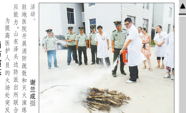
迎峰度夏 电所的电器设备进行年度检修,确保属的三十座一百一十千伏及以上变电站,浙江金华电业局开始对所属