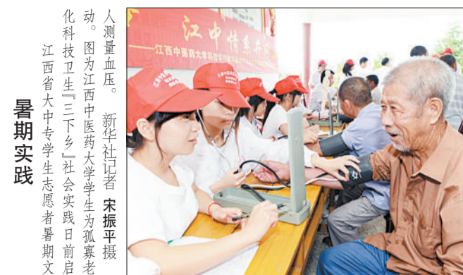
迎峰度夏  电所的电器设备进行年度检修,确保属的三十座一百一十千伏及以上变电站,浙江金华电业局开始对所属