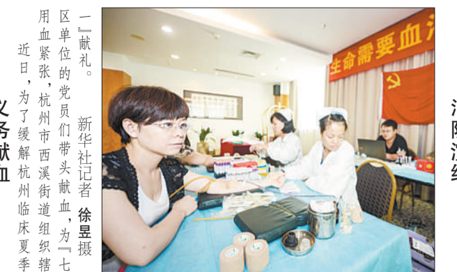
驻地医院开展消防疏散和灭火演练活动。山东烟台边防派出所联合消防演练,为提高医护人员火灾应急处置能力,烟台边防派出所联合消防演练,为提高医护人员火灾应急处置能力