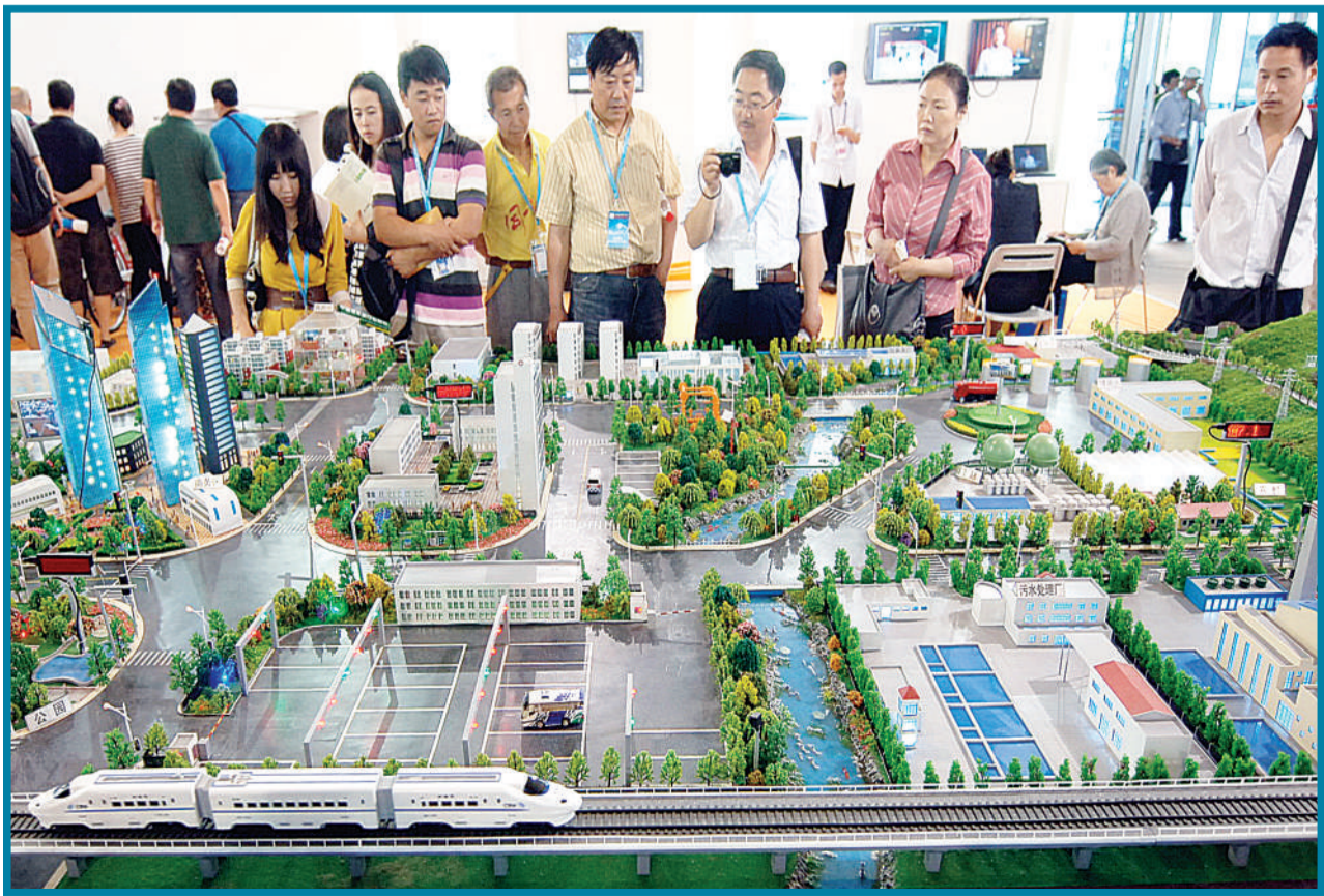
中实展业制作的智能物联网应用技术城市管理模型。