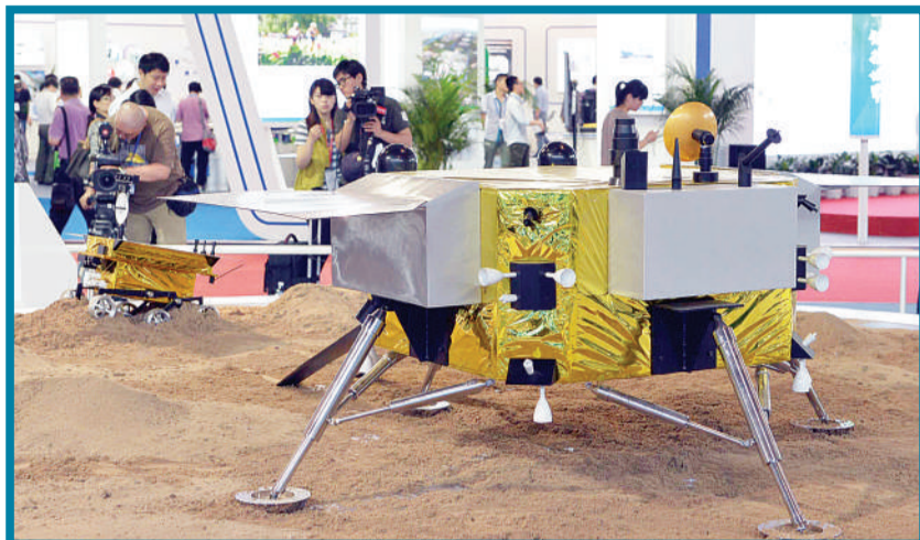
作为保证我国探月二期工程顺利实施的核心部分:嫦娥三号着陆器和巡视器模型。