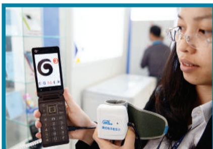
带有测量血压功能的手机。