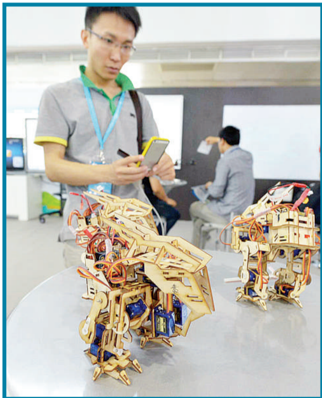
“车库咖啡”小微科技企业孵化器展台。