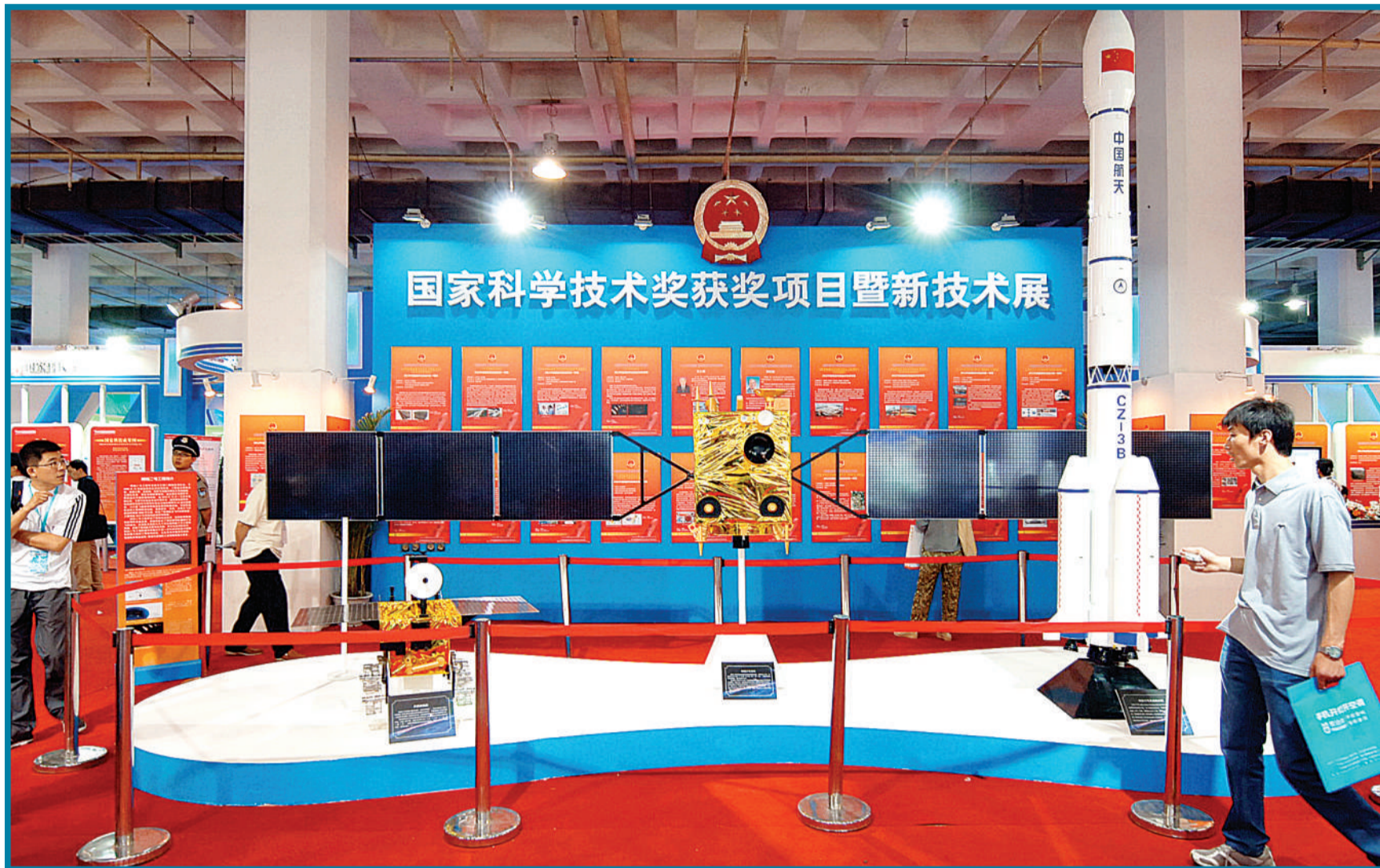
展馆内举办的国家科学技术奖获奖项目暨新技术展。