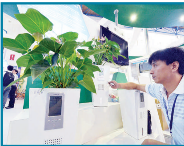
新型家庭空气过滤器将室内有毒气体转化为植物所需的营养物质。