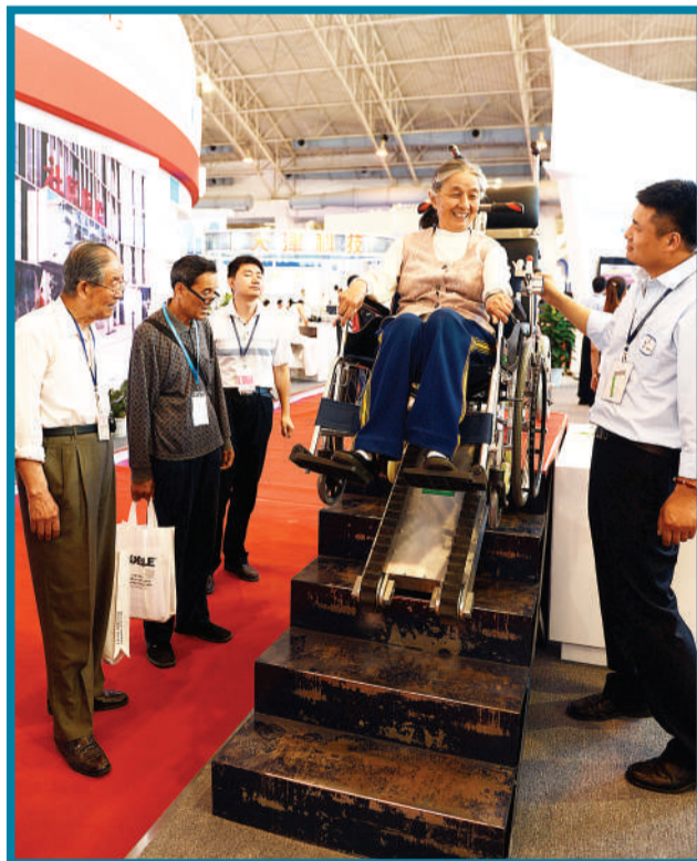
北京互邦之家爬楼车技术开发有限公司生产的无障碍爬楼车。