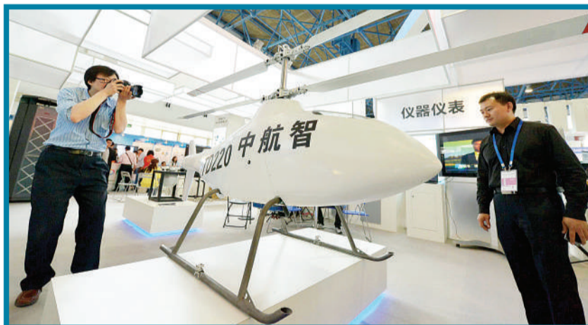
中航智能公司推出的具有自主知识产权的无人直升机。