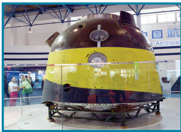
航天科技专题展上展示的神舟九号飞船返回舱模型。