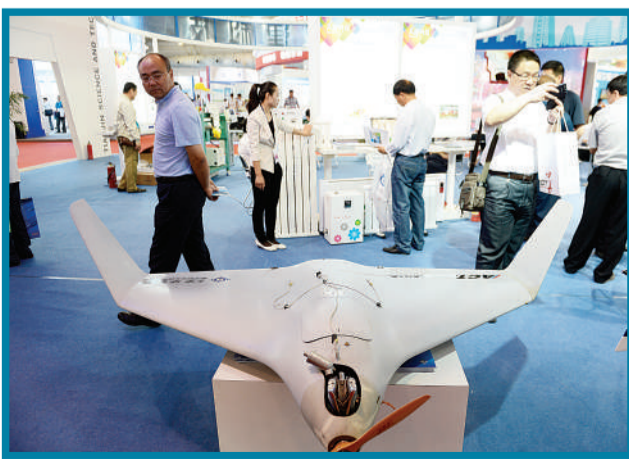
利用无线电遥控操作的无人飞机。