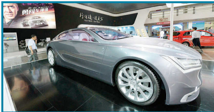
北汽集团推出的最新北京牌概念车。