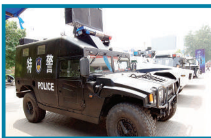
多功能强声驱散防暴车。