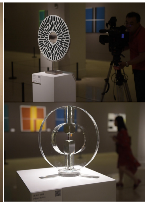
6月17日,“匈牙利当代艺术展”在中国美术馆开幕。该展览作为中国美术馆国际交流展系列之一,共展出来自匈牙利艺术家的99件绘画作品和24件雕塑作品。展览将持续至7月20日。