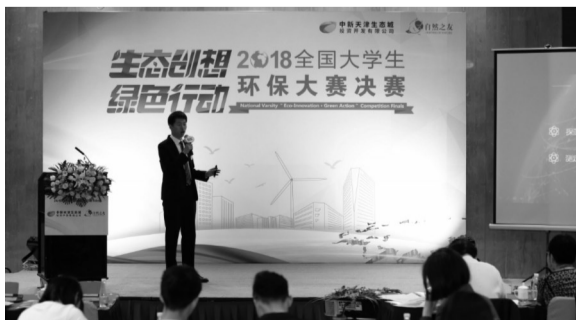
获得冠军的西北工业大学团队在展示他们的项目。