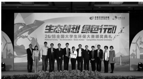
相关领导与冠军团队西北工业大学及其他嘉宾合影留念。