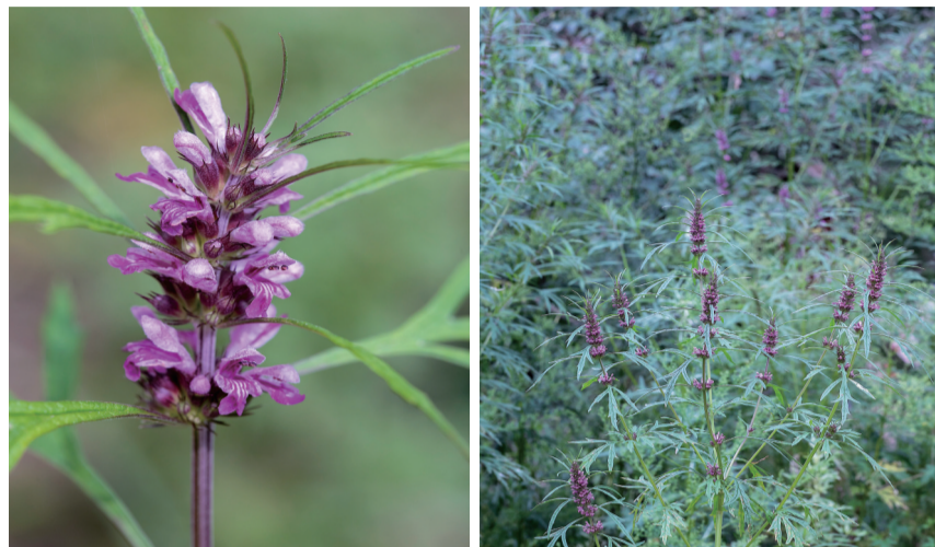
左图为益母草轮伞花序,右图为益母草群落。

“谷中有益母草,天旱无雨将枯槁。有位女子遭遗弃,内心叹息又苦恼。内心叹息又苦恼,嫁人不淑受煎熬。”《诗经》里的《王风·中谷有蓷》,是一首反映东周时期社会底层妇女生活状况的情感诗,表述了女子被男子遗弃之后的痛苦和愤懑。