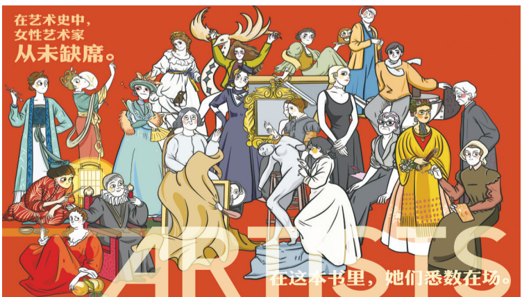
《艺术史的另一半——为什么没有伟大的女艺术家？》，李君棠著，垂垂绘，广西师范大学出版社出版。图为插图。