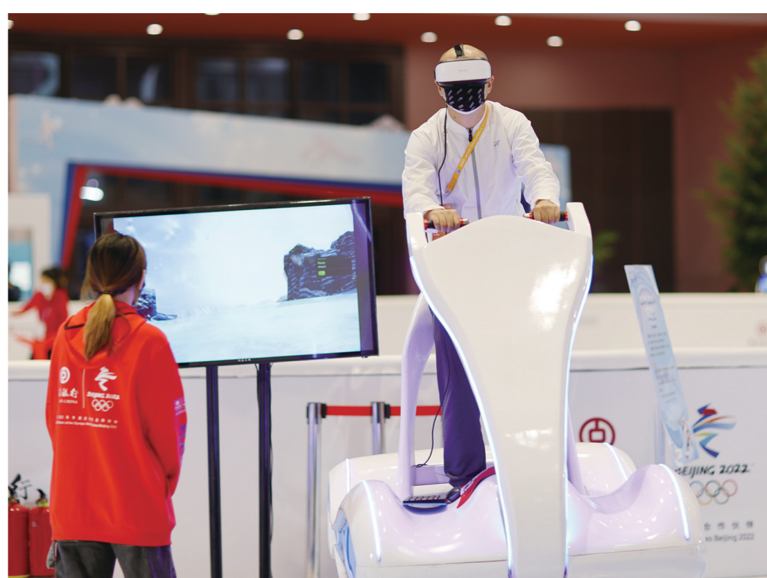
图为参观者在展区里体验VR滑雪。