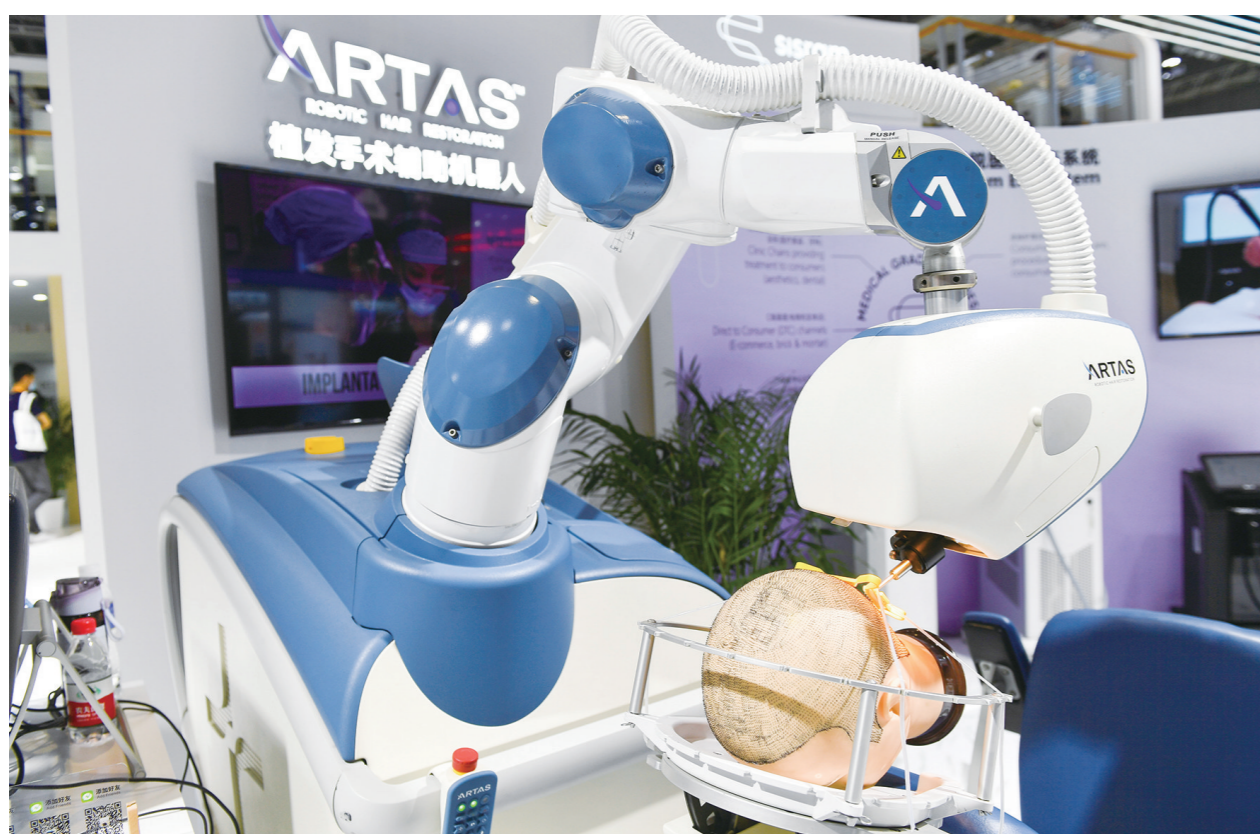
各种类型的人工智能机器人在进博会上大显身手，吸睛无数。图为植发机器人。

“闪测方舱”“飞行汽车”“植发机器人”……正在上海举办的第四届中国国际进口博览会吸引了2900多家中外参展商参展，420多项新产品、新技术、新服务亮相，科技含量高、创新能力强的展品成为大会亮点。