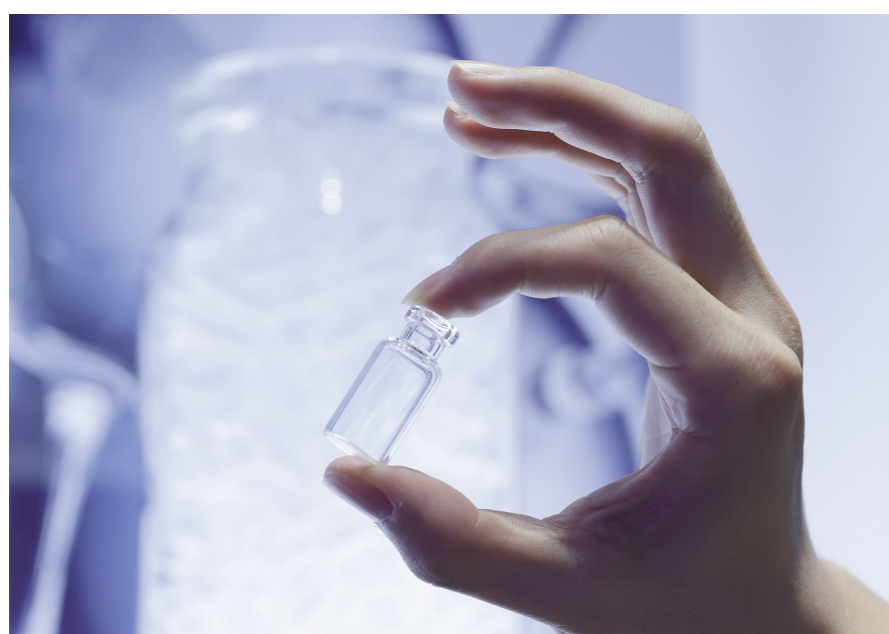
新冠疫苗玻璃管亮相进博会。图为德国肖特集团展示新冠疫苗玻璃管。