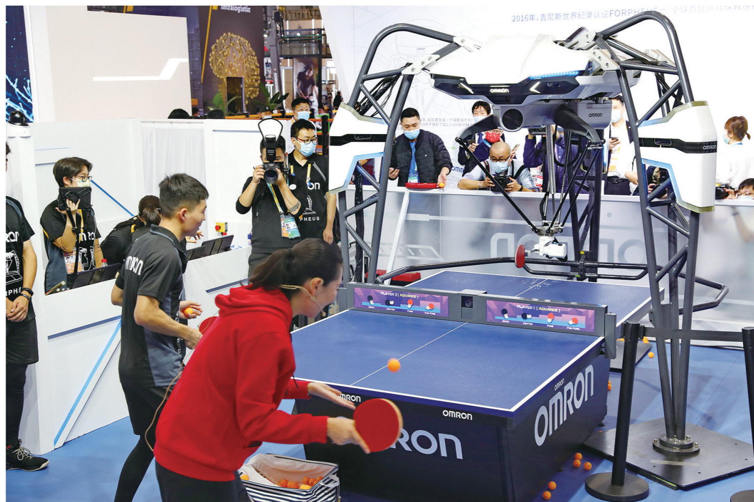
图为搭建房屋的工业六轴机器人、书法模仿智能机器人、进行幼苗筛选和栽培的六轴机器人、乒乓球陪练机器人、会冲泡的咖啡智能机器人、电脑绣花和缝纫一体机等，在进博会技术装备展区大显身手，吸引了众多现场观众参观、拍摄。