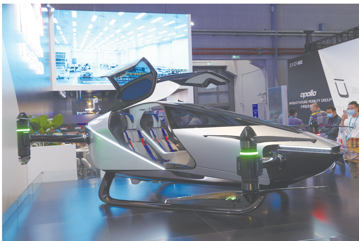
图为小鹏飞行汽车亮相。