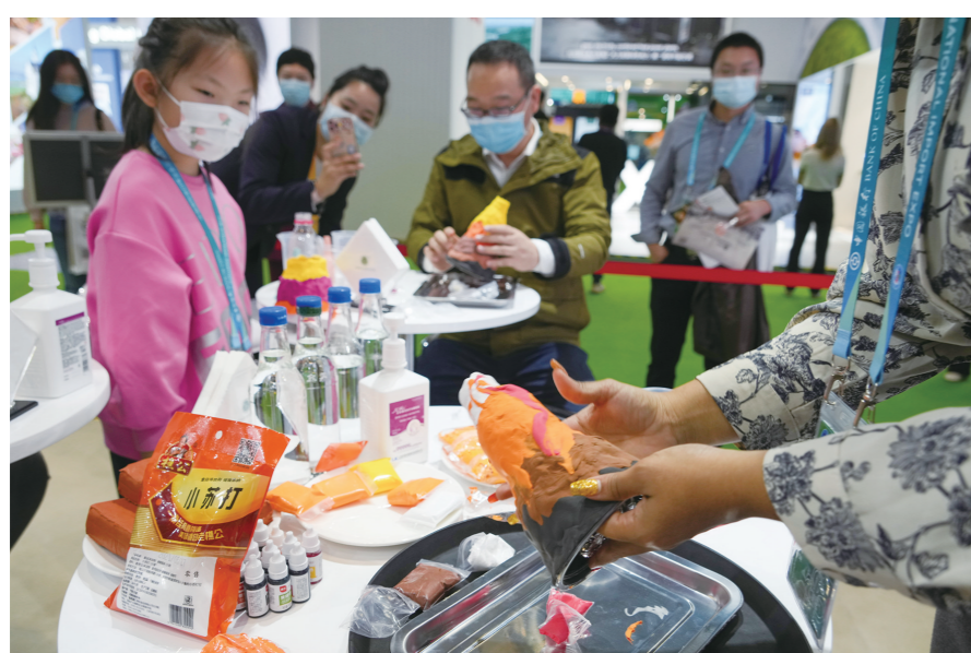
图为服务贸易展区的STCC上海嘉庭美好生活馆展台上，讲师带领家长和小朋友利用环保可回收材料制作火山喷发模型，培养青少年科学性、创造性的环保理念。