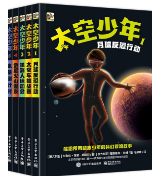
《太空少年》系列书籍封面

电子工业出版社新近出版的《太空少年》是一套写给所有励志少年的科幻冒险小说。未来时空的太阳系中，各大行星都已成为宜居星球，太空少年杰克因学习太空车驾驶技术而结识了其他4个小伙伴。通过一个又一个惊险刺激的太空冒险，他们揭开一个又一个谜团和阴谋，用智慧和勇气创造了无数奇迹，拯救了我们充满爱与温暖的家园。故事情节跌宕起伏，节奏紧凑，加上环环相扣的悬念设置，给小读者们带来酣畅淋漓的阅读体验。