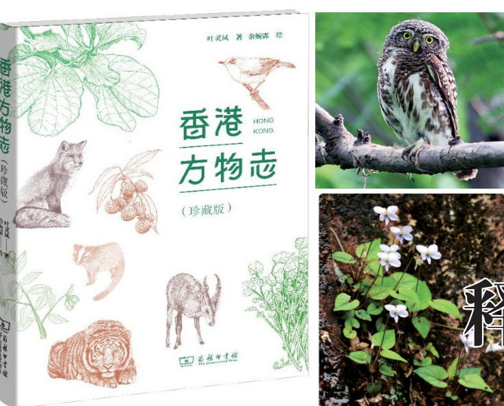
《香港方物志》，叶灵凤著，余婉霖绘，商务印书馆2017年9月第1版。

还有两个很好的展览，一个叫四僧展，四个清初的和尚，弘仁、髡残、八大山人、石涛，从来没有一起展过，他们四个人谁也不认识。但是他们是一个时代、一种倾向，各具