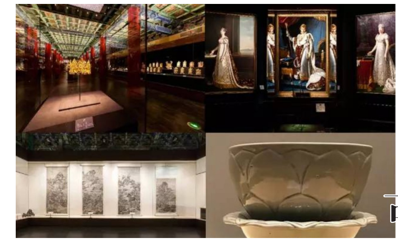
故宫博物院举办的展览

全联不仅对仗工整，洋洋洒洒，流畅奔放，一气呵成，而且抒情绘景，层层递进，气势非凡。